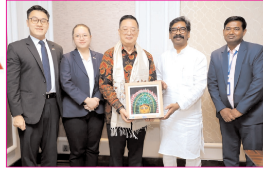
नई दिल्ली में आयोजित दो दिवसीय नेशनल स्टेकहोल्डर्स कंसल्टेशन में आये उद्योगपतियों के साथ सीएम हेमंत सोहन