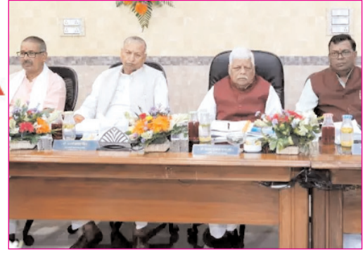
धनबाद रेल मंडल संसदीय समिति की बैठक में मौजूद सांसदगण