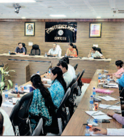
उपायुक्त ने इरो, एरो, नोडल पदाधिकारियों और बीएल ओ को घर-घर जाकर प्रत्येक पात्र मतदाता