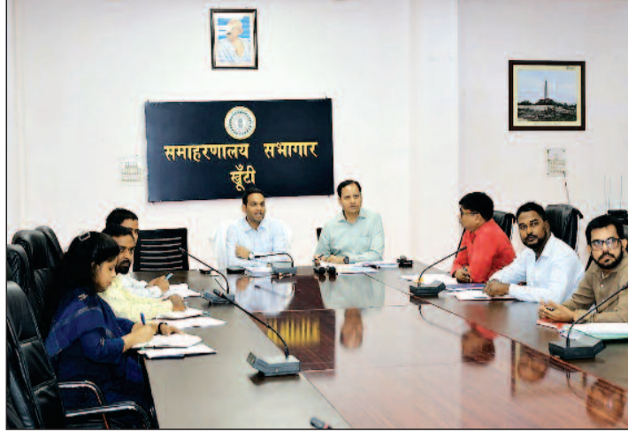
आवास योजना (ग्रामीण) की समीक्षा के दौरान उपायुक्त ने कहा कि जिन लाभुकों को किस्त की राशि उपलब्ध करा दी गई है, उनके निर्माणधीन एवं लंबित आवासों को शीघ्र पूर्ण कराया जाए। उन्होंने सभी प्रखंड

खूंटी। समाहर्णालय स्थित सभागार में उपायुक्त मो० जावेद हुसैन की अध्यक्षता में ग्रामीण विकास, पंचायती राज एवं जिला परिषद अंतर्गत संचालित योजनाओं एवं कार्यों की समीक्षा बैठक आयोजित की गई। बैठक में वीडियो कॉन्फ्रेंसिंग के माध्यम से सभी प्रखंड विकास पदाधिकारियों ने भाग लिया। बैठक में ग्रामीण विकास विभाग की समीक्षा के दौरान उपायुक्त ने मनरेगा के तहत मानव दिवस सुजन, पूर्ण एवं लंबित योजनाओं की विस्तार से समीक्षा की। उन्होंने सभी प्रखंडों में लंबित योजनाओं को प्राथमिकता के आधार पर शीघ्र पूर्ण करने तथा योजनाओं के गुणवत्तापूर्ण क्रियान्वयन को सुनिश्चित करने का निर्देश दिया। साथ ही विशेष शिबिर आयोजित कर शत-प्रतिशत ई-केवाईसी (1-डूड) कार्य पूर्ण करने, एरिया ऑफिसर मॉनिटरिंग ऐप पर नियमित रिपोर्टिंग करने एवं सामग्री मद के भुगतान को नियमित रूप से सुनिश्चित करने के निर्देश दिए। प्रधानमंत्री