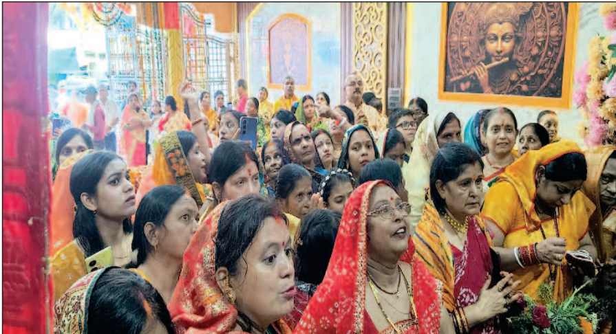
आध्यात्मिकता का वातावरण बना रहा। श्रद्धालुओं ने मां काली और संकटमोचक भगवान हनुमान के दर्शन कर सुख-समृद्धि की कामना की। मंदिर के बाहर से गुजरने वाले राहगीरों और वाहन चालकों ने भी

नवबिहार टाइम्स संवाददाता खूंटी। शहर की आराध्य ग्राम देवी के रूप में प्रसिद्ध सार्वजनिक दुर्गा मंदिर (देवी गुड़ी) में तीसरे दिन बुधवार को मां काली और भगवान बजरंगबली की प्रतिमाओं की प्राण प्रतिष्ठा वैदिक मंत्रोच्चारण और धार्मिक विधि-विधान के साथ संपन्न हुई। प्राण प्रतिष्ठा के बाद जैसे ही मंदिर के पट श्रद्धालुओं के लिए खोले गए, पूरा परिवार जयकारों से गुंज उठा और दर्शन के लिए भक्तों की लंबी कतार लग गई। छह जुलाई से चल रहे तीन दिवसीय धार्मिक अनुष्ठान का समापन हवन, पूजा-अर्चना और बनारस से आए आचार्यों द्वारा गंगा आरती के साथ हुआ। पूरे मंदिर परिवार में भक्ति और