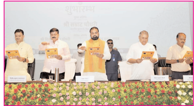
बिहार सतर्कता जागरूकता सप्ताह के तहत शपथ लेते सीएम सम्राट चौधरी एवं अन्य

* मूल्य : 3.00 रुपये * औरंगाबाद, पटना एवं बोकारो से प्रकाशित * www.navbihartime.com