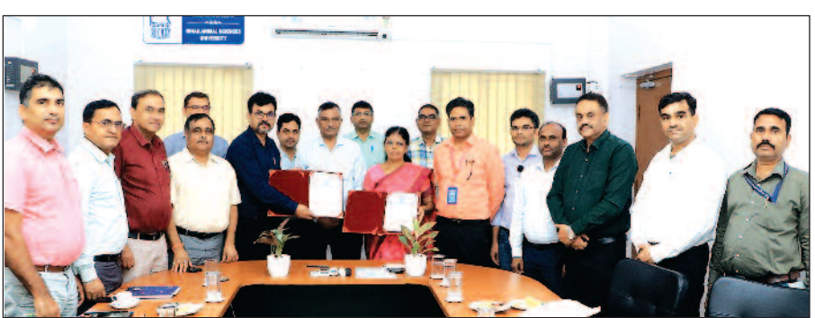
चिकित्सीय, टॉक्सिकोलॉजी और मेडिकल डिवाइस के प्री-क्लीनिकल मूल्यांकन संबंधी अध्ययन करेंगे। साथ ही

पटना/नवबिहार टाइम्स ब्यूरो। बिहार पशु विज्ञान विश्वविद्यालय, पटना और राष्ट्रीय औषधीय शिक्षा एवं अनुसंधान संस्थान, हाजीपुर के बीच बुधवार को विश्वविद्यालय के कुलपति सभागर में अनुसंधान, शैक्षणिक सहयोग और नवाचार को बढ़ावा देने के लिए समझौता ज्ञापन (एमओयू) पर हस्ताक्षर किए गए। एमओयू के तहत दोनों संस्थान औषधीय एवं पशु चिकित्सा विज्ञान के क्षेत्र में संयुक्त अनुसंधान, फैकल्टी, वैज्ञानिकों और विद्यार्थियों के आदान-प्रदान, जर्नलजम् एवं जैविक नमूनों के आदान-प्रदान तथा बड़े और छोटे पशुओं पर डायग्नोस्टिक,