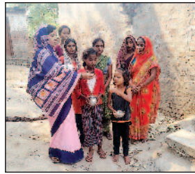
सहयोग 99.25 प्रतिशत योग्य लाभार्थियों को दवा खिलाई गई है। 57 घरों के 169 वंचित योग्य लाभार्थियों को फाइलरिया रोधी दवाओं का कराया गया सेवन