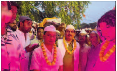
बाद उन्होंने मोहम्मद के शहर में, सारे बोलो या अली, आओ रे चिरवी खेले होली खजाजा पिया के आंगन में व हम हुसैन वाले हैं समेत एक से बढ़कर एक कव्वाली व शायरी पेश कर उपस्थित लोगों को झुमने पर मजबूर कर दिया। पूरी रात लोगों ने कव्वाली का आनंद लिया। तकरीर में कहा गया कि बाबा के दरबार से कोई खाली हाथ नहीं लौटता। श्रद्धा से मांगी गयी सभी मुरादें बाबा पूरी करते हैं। सालाना उर्स के मौके पर पवित्र दरगाह के समीप मेले जैसा माहौल रहा। मेले में लगी दुकानों पर खरीदारों के लिए भीड़ उमड़ पड़ी। विभिन्न स्थानों से आए लोगों ने पवित्र दरगाह पर माथा टेका और मन्तवें मांगी। लोगों ने नेक नीयत से हिंदू समुदाय द्वारा बेचे जा रहे फूलों को खरीदा और पवित्र दरगाह पर चढ़ाया। लोगों के बीच खिचड़ी और खुरमा का वितरण शिरनी के रूप में किया गया।