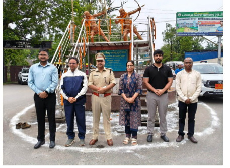
उन्होंने कहा कि आज का दिन हमें यह संकल्प लेना चाहिए कि हम सामाजिक एकाता, समरसता और स्वतंत्रता के मूल्यों को बनाए रखें और सिदो-कान्हू, चांद भैरव, फूलो झानो के आदर्शों को अपने जीवन में आत्मसात करें। "हूल दिवस" को गरिमामय रूप से मनाते हुए जनमानसों को देश की आजादी में आदिवासी समाज के योगदान से अवगत कराया गया।