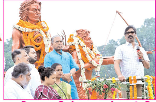
हूल दिवस पर सिदो-कान्हू को श्रद्धांजलि अर्पित करते सीएम हेमंत सोरेन एवं अन्य