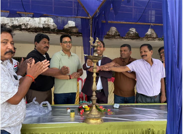
निवासी एवं राष्ट्रीय ट्रांसपोर्ट, हजारीबाग के अच्छे खिलाड़ी, अच्छे कोच एवं रेफरी के निधन पर दो मिनट का मौन रखकर श्रद्धांजलि अर्पित की गई।