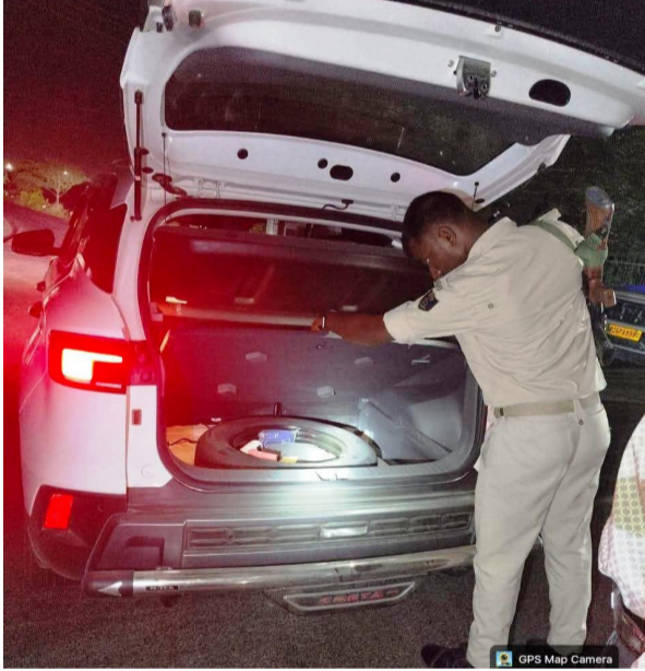
व्यक्तियों एवं वाहनों की गहन तलाशी लेकर उनकी पहचान