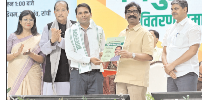
अच्छी शिक्षा देना और उन्हें आत्मनिर्भर बनाना अब इन शिक्षकों की सबसे बड़ी जिम्मेदारी होगी। यदि सभी अपनी जिम्मेदारी ईमानदारी से निभाएं तो राज्य में बेहतर माहौल बनाया जा सकता है। मुख्यमंत्री ने कहा कि आपको आने वाली पीढ़ी का भविष्य तय करना है। सरकारी संस्थानों पर बहुत उंगलियां उठती हैं। कुछ सही भी होती है और

रांची। झारखंड सरकार ने राज्य के प्राथमिक और मध्य विद्यालयों में शिक्षकों की कमी को दूर करने की दिशा में एक महत्वपूर्ण कदम उठाते हुए 1,042 नवचयनित सहायक शिक्षकों को नियुक्ति पत्र प्रदान किया। रांची के खेलगांव में आयोजित इस समारोह में मुख्यमंत्री हेमंत सोरेन ने नवनि्युक्त शिक्षकों को नियुक्ति पत्र सौंपकर उनके उज्ज्वल भविष्य की शुभकामनाएं दीं। मुख्यमंत्री हेमंत सोरेन ने कहा कि यहां नियुक्ति पत्र पाने वाले सभी सहायक आचार्य अपने परिवारों के साथ आए हैं, जिनके चेहरे पर बहुत खुशी है। नवनि्युक्त शिक्षकों को संबोधित करते हुए मुख्यमंत्री ने कहा कि शिक्षक केवल पढ़ाने का काम नहीं करते बल्कि वे आने वाली पीढ़ी का भविष्य भी तैयार करते हैं। उन्होंने कहा कि बच्चों को