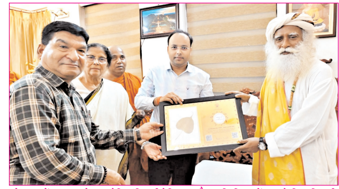
बोधध्याय में सद्गुरु का महाबोध मंदिर की रेलिंका और स्मृति चिह्न भेंट करते जिलाधिकारी

* मूल्य : 3.00 रुपये * औरंगाबाद, पटना एवं बोकारो से प्रकाशित * www.navbihartime.com