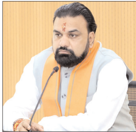
कार्ययोजना एवं समयसीमा निर्धारित करते हुए सभी कार्य समय पर पूर्ण करें। मुख्यमंत्री ने कहा कि मेट्रो निर्माण कार्य के दौरान आम नागरिकों को न्यूनतम

पटना। मुख्यमंत्री सम्राट चौधरी ने सोमवार को लोक सेवक आवास स्थित संकल्प सभागार में पटना मेट्रो रेल परियोजना की प्रगति की उच्चस्तरीय समीक्षा की। समीक्षा के दौरान मुख्यमंत्री ने अधिकारियों को निर्देश देते हुये कहा कि पटना मेट्रो रेल परियोजना के सभी कार्य निर्धारित समय सीमा के भीतर उच्च गुणवत्ता के साथ पूर्ण करें। उन्होंने कहा कि 02 जुलाई को मलाही पकड़ी तक के मेट्रो रेल परियोजना के विस्तारीकरण का लोकार्पण किया जायेगा जिससे शहरवासियों को आवागमन में सहूलियत होगी साथ ही समय की भी बचत होगी। पटना मेट्रो शहर की परिवहन व्यवस्था को आधुनिक, सुरक्षित एवं सुविाजनक बनानेवाली एक महत्वपूर्ण परियोजना है, इसलिए इसके क्रियान्वयन में किसी प्रकार की शिथिलता स्वीकार्य नहीं होगी। उन्होंने कहा कि परियोजना के प्रत्येक चरण के लिए स्पष्ट