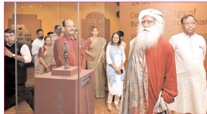
राजधानी पटना स्थित बिहार संग्रहालय का भ्रमण करते सदगुरु

* मूल्य : 3.00 रुपये * औरंगाबाद, पटना एवं बोकारो से प्रकाशित * www.navbihartime.com