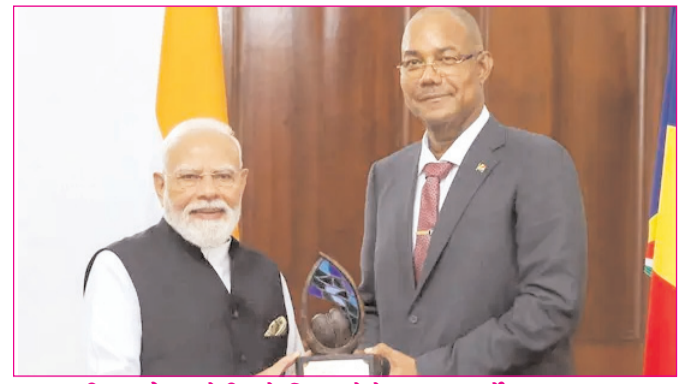
पीएम नरेन्द्र मोदी को मिला सेशेल्स का सर्वोच्च सम्मान