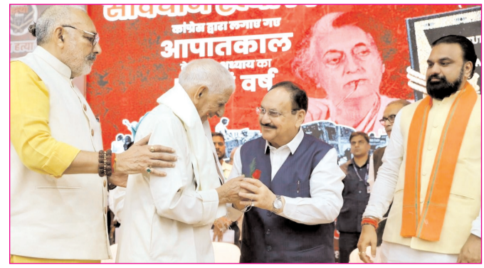
पटना में जेपी सेनानी को सम्मानित करते केन्द्रीय स्वास्थ्य मंत्री जय प्रकाश नड्डा