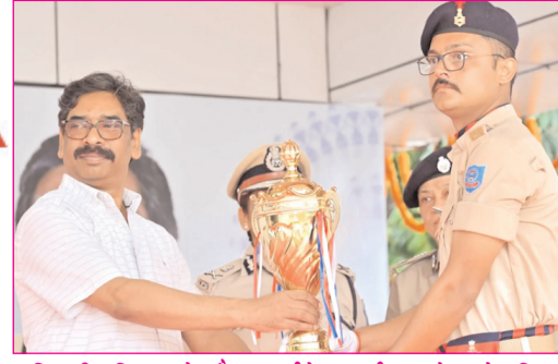
बुनियादी प्रशिक्षण के दौरान सर्वश्रेष्ठ प्रदर्शन करने वाले पुलिस जवान को ट्राफी देकर सम्मानित करते सीएम हेमंत सोरेन