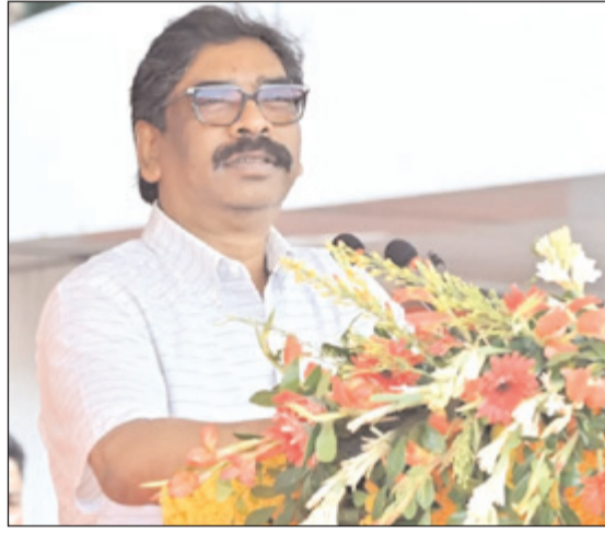
दौरान उनके स्वजन ने भी प्राणों की आहूति दी है। स्वजनों के उसी अधूरे रास्ते और सफर को पूरा करने की

मुख्यमंत्री ने कहा कि सबसे अधिक खुशी देने वाली बात यह है कि इस बैच में लगभग 25 प्रतिशत महिलाओं की भागीदारी है। वे चाहते हैं कि राज्य के हर क्षेत्र में पुरुषों और महिलाओं की भागीदारी समान हो। पुलिस सिर्फ एक व्यक्ति मात्र या खुद के लिए नहीं बल्कि राज्य के आम नागरिकों की रक्षा के लिए समर्पित है। आज से सभी प्रशिक्षु एक व्यवस्था से बंध चुके हैं। कर्तव्य निर्वहन के दौरान हो सकता है बड़ी आहूति दी है। स्वजनों के उसी अधूरे रास्ते और सफर को पूरा करने की