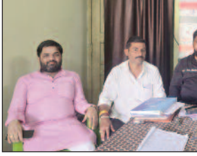
अधिक से अधिक संख्या में भागीदारी सुनिश्चित करने की अपील करते हुए कहा कि युवा कांग्रेस नई पीढ़ी को नेतृत्व का अवसर देने के लिए प्रतिबद्ध है। बैठक में उपस्थित युवाओं को नामांकन प्रक्रिया, सदस्यता, चुनावी नियमों तथा आवेदन की तकनीकी जानकारी विस्तार से दी गई। साथ ही उनके प्रश्नों का समाधान कर प्रक्रिया को सरल बनाने का प्रयास किया गया। संगठन से जुड़ने के लिए डिजिटल माध्यम से सदस्यता शुल्क मात्र 75 त्व किया गया है। अध्यक्ष पद के लिए सामान्य वर्ग के उम्मीदवारों का नामांकन शुल्क 20,000 है, जबकि अनुसूचित जाति, अनुसूचित जनजाति, आबंसी और महिलाओं के लिए यह

मुंगेर/नवबिहार टाइम्स संवाददाता। युवक कांग्रेस को चुनाव की प्रक्रिया पूरी तरह से पारदर्शी होगी। यह बात युवक कांग्रेस की संगठनात्मक चुनाव प्रक्रिया की जानकारी देते हुए जिला कांग्रेस मुख्यालय, तिलक मैदान में जोनल रिटर्निंग ऑफिसर सहाय शंख ने कही। शंख ने बताया कि युवा कांग्रेस के प्रदेश अध्यक्ष, जिला अध्यक्ष और जिला महासचिव पदों के लिए नामांकन, सदस्यता अभियान और मतदान की प्रक्रिया पूरी तरह लोकतांत्रिक एवं पारदर्शी होगी। उन्होंने युवाओं से बड़ी संख्या में सदस्य बनकर संगठन को मजबूत करने का आह्वान किया। संगठन चुनाव के लिए नामांकन प्रक्रिया 18 जून से 28 जून तक चलेगी। उन्होंने बताया कि 18 से 35 वर्ष आयु वर्ग के युवक-युवतियां इसमें भाग लेकर संगठन में सक्रिय भूमिका निभा सकते हैं। नामांकन की पूरी प्रक्रिया मोबाइल अनुप्रयोग के माध्यम से संपन्न होगी, जिसके लिए अभ्यर्थियों को आवश्यक दस्तावेजों के साथ आवेदन करना होगा। उन्होंने युवाओं से