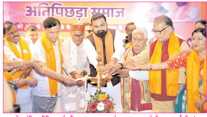
पटना में आयोजित अतिपिछड़ा समाज व अभिनन्दन सह आभार समारोह का उद्घाटन करते सीएम सप्रत चौधरी एवं अन्य

* रजि. नंबर : 52290/90 * वर्ष : 37 * अंक : 27 * पृष्ठ : 12 * औरंगाबाद, मंगलवार, 23 जून 2026 * मूल्य : 3.00 रुपये * औरंगाबाद, पटना एवं बोकारो से प्रकाशित * www.navbihartime.com