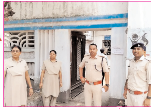
धनबाद में नीट परीक्षा को लेकर सुरक्षा में तैनात जवान