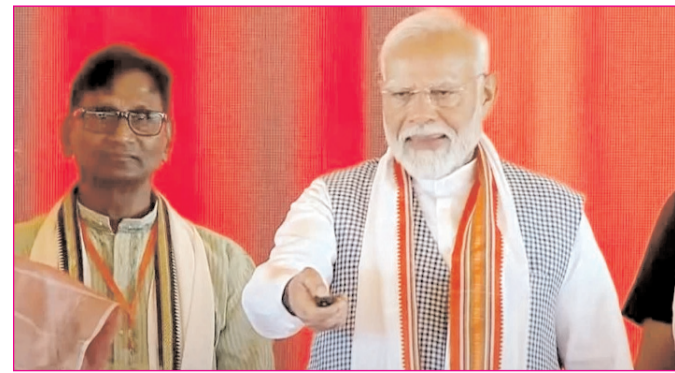
किसानों के खेतों में पीएम किसान सम्मान निधि की राशि हस्तांतरित करते पीएम नरेन्द्र मोदी