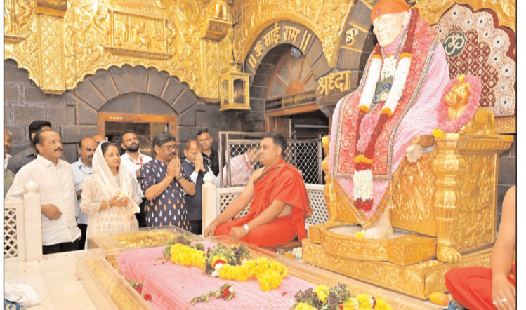
बाबा के दर्शन किए हैं। हालांकि शिरडी आने वाले लोगों की संख्या कम हो गई है लेकिन झारखंड राज्य में साई बाबा के कई मंदिर हैं। सीएम हेमंत सोरेन ने कहा कि वे प्रदेश में साई बाबा मंदिर में दर्शन करने जाते रहते हैं। उन्होंने कहा कि साई बाबा के आशीर्वाद से ही हम सभी लोगों की सेवा के लिए काम कर रहे हैं। उन्होंने कहा कि वह साई बाबा के चरणों