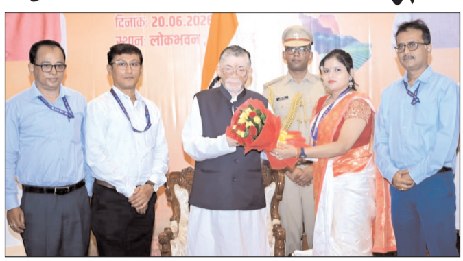
बंगाल का संबंध केवल भौगोलिक निकटता तक सीमित नहीं है बल्कि दोनों राज्यों के बीच सांस्कृतिक, सामाजिक और भावनात्मक संबंध भी अत्यंत गहरे हैं। राज्यपाल ने झारखंड में निवासरत बंगाली समाज के शिक्षा, संस्कृति, उद्योग, व्यापार और सामाजिक जीवन के विभिन्न क्षेत्रों में दिए गए उल्लेखनीय योगदान की सराहना करते हुए उन्हें बधाई दी।