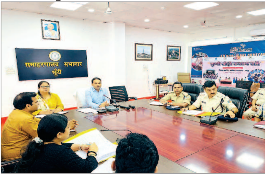
उएए (वक्र) परीक्षा की तैयारियों की विस्तृत समीक्षा करते हुए सभी संबंधित अधिकारियों को अपने दायित्वों का निर्वाहन पूरी सतर्कता एवं जिम्मेदारी के साथ करने का निर्देश दिया।

नवबिहार टाइम्स संवाददाता खूँटी। उपायुक्त मो० जावेद हुसैन की अध्यक्षता में आज समाहरणालय सभागार में उएए (वक्र) परीक्षा-2026 के सफल, निष्पक्ष एवं कदाचारमुक्त आयोजन को लेकर समीक्षा बैठक आयोजित की गई। बैठक में परीक्षा से संबंधित सभी प्रतिनियुक्त दंडाधिकारी, पुलिस पदाधिकारी एवं अन्य संबंधित अधिकारियों ने भाग लिया। उल्लेखनीय है कि राष्ट्रीय परीक्षा एजेंसी द्वारा आयोजित परीक्षा-2026 का आयोजन दिनांक 21 जून 2026 को अपराह्न 2:00 बजे से 5:00 बजे तक किया जाएगा। खूँटी जिले में परीक्षा के लिए पीएम श्री केंद्रीय विद्यालय, डुमरदगा, खूँटी को परीक्षा केंद्र बनाया गया है। बैठक में उपायुक्त