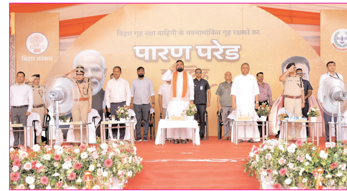
बिहार गृह रक्षा वाहिनी के नवनामांकित जवानों के पारण परेड समारोह में सीएम सम्राट चौधरी एवं अन्य

* औरंगाबाद, पटना एवं बोकारो से प्रकाशित * www.navbihartime.com