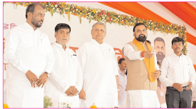
पटना के नदियावां में आयोजित प्रखंड सहयोग-सह-जन-कल्याण शिविर का उद्घाटन करते सीएम सम्राट चौधरी

* मूल्य : 3.00 रुपये * औरंगाबाद, पटना एवं बोकारो से प्रकाशित * www.navbihartime.com