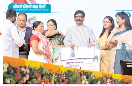
रांची के मोराहाबदी मैदान में आयोजित कृषि उत्पादन मेला के दौरान लाभुकों के बीच परिसंपत्तियों का वितरण करते मुख्यमंत्री हेमंत सोरेन