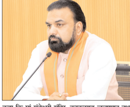
कहा कि मां मुंडेश्वरी मंदिर, करकटगढ़ जलप्रपात तथा राजगीर के लिए पर्यटकों की सुविधा सुविधा हेतु अनुदानित दर पर हेलिकॉप्टर सेवा प्रारंभ की जाय साथ ही वाल्मीकिनगर के लिए शनिवार एवं रविवार को पर्यटकों के लिये रियायती दर पर वायुसेवा शीघ्र प्रारंभ करें। पर्यटकों की सुविधा के लिए पटना प्रस्थान से आगमन तक 'एंड-टू-एंड' सेवा बिहार राज्य पर्यटन विकास निगम द्वारा शुरू की जायेगी। विष्णुपद मंदिर कारिडोर और महाबोधि मंदिर कारिडोर की परियोजना को शीघ्र अंतिम रूप देकर कार्य प्रारंभ कराया जाय। राजगीर में पर्यटकों को आकर्षित करने के लिए अत्याधुनिक सुविधाओं का विस्तार और सुधार किया जाएगा। उन्होंने कहा कि राजगीर की ऐतिहासिक महत्ता को देखते हुए इसे आध्यात्मिक शिक्षा के वैश्विक केंद्र के रूप में स्थापित किया जाएगा। नालन्दा की वैश्विक पहचान की पुनर्स्थापना की जायेगी साथ ही विश्व धरोहर दर्जे को और सुदृढ़ किया जाएगा। नालन्दा को वैश्विक ज्ञान और सांस्कृतिक केंद्र के रूप में फिर से स्थापित करने के लिए एक विशेष एकीकृत पैकेज तैयार किया जाएगा। पर्यटन क्षेत्रों में निवेश और बेहतर प्रबंधन के लिए पीपीपी मोड को बढ़ावा