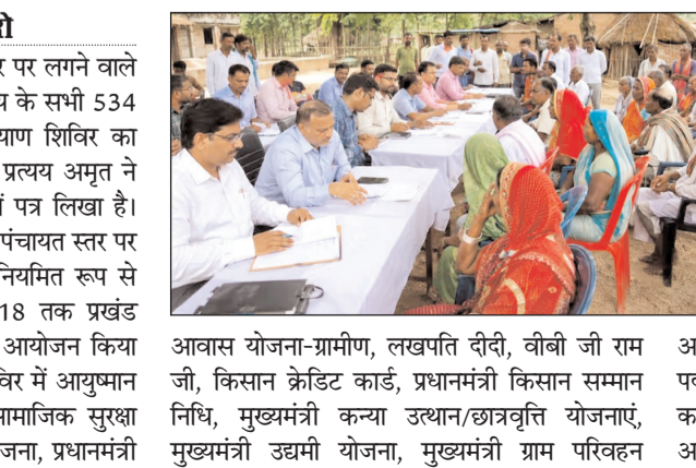
आवास योजना-ग्रामीण, लखपति दीदी, वीबी जी राम जी, किसान क्रेडिट कार्ड, प्रधानमंत्री किसान सम्मान निधि, मुख्यमंत्री कन्या उद्यान/छात्रवृत्ति योजनाएं, मुख्यमंत्री उद्यमी योजना, मुख्यमंत्री ग्राम परिवहन

पटना। पंचायत और नगर पंचायत स्तर पर लगने वाले सहयोग शिविर के तर्ज पर ही अब राज्य के सभी 534 प्रखंडों में भी सहयोग सह जन कल्याण शिविर का आयोजन किया जाएगा। मुख्य सचिव प्रत्यय अमृत ने सभी जिलाधिकारियों को इस संबंध में पत्र लिखा है। यह कहा गया है कि पंचायत और नगर पंचायत स्तर पर आयोजित होने वाले सहयोग शिविर नियमित रूप से जारी रहेंगे। इस महीने की 16 से 18 तक प्रखंड सहयोग-सह-जन-कल्याण शिविर का आयोजन किया जाएगा। प्रखंड स्तर पर लगने वाले शिविर में आयुष्मान भारत, आयुष्मान वय वंदना कार्ड, सामाजिक सुरक्षा पेंशन, पीएम सूर्य घर-मुफ्त बिजली योजना, प्रधानमंत्री