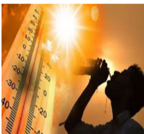
अपने पूरे चरम पर है। लोगों की उम्मीद से ज्यादा गर्मी पड़ रही है। आम तौर पर इन्हीं दिनों तापमान बढ़कर 38 एवं 39 डिग्री तक पहुंच गया है लेकिन इस बार

नवबिहार टाइम्स संवाददाता औरंगाबाद। भीषण गर्मी व झुलसा देने वाली चिलचिलाती धूप से लोग परेशान हो रहे हैं। गर्म हवा शरीर में चुभने लगी है। इससे लोगों का कामकाज प्रभावित हुआ है। पंखे कूलर भी गर्मी से बचाव में नाकामो साबित हो रहे हैं। रिविचार की दोपहर दो बजे के करीब धूप की वजह से शहर की ज्यादातर सड़कें सूनी रही। धूप में निकलने की बजाए लोग दुकानों और घरों में रहना सुरक्षित महसूस कर रहे हैं। जून के मध्य में गर्मी