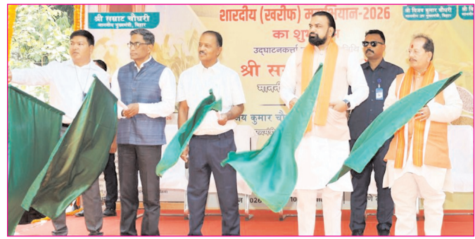
पटना में किसान जागरूकता वाहनो को हरी झंडी दिखाकर खरीफ महाभियान का शुभारंभ करते सीएम सम्राट चौधरी

* मूल्य : 3.00 रुपये * औरंगाबाद, पटना एवं बोकारो से प्रकाशित * www.navbihartime.com