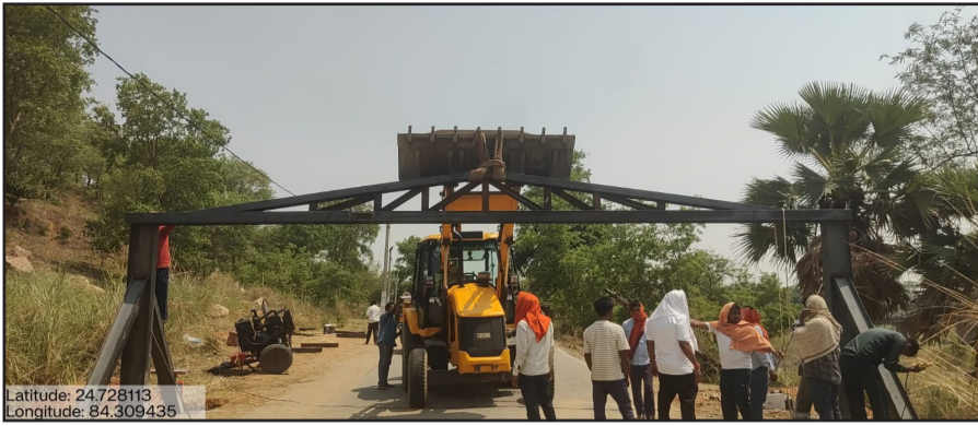
Latitude: 24.728113 Longitude: 84.309435