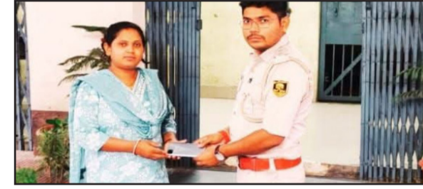
लंबे समय बाद अपना कीमती मोबाइल वापस मिलने पर उनके चेहरे खुशी से खिल उठा। मोबाइल प्राप्त करने वाली महिला ने पुलिस की त्वरित कार्रवाई और प्रभावी कार्यशैली की सराहना करते हुए आभार व्यक्त किया। उसने बताया कि उन्हें उम्मीद नहीं थी कि खोया हुआ मोबाइल दोबारा मिल सकेगा, लेकिन

नवबिहार टाइम्स संवाददाता मदनपुर। ऑपरेशन मुस्कान के तहत रिविचार को मदनपुर के विभिन्न थाना क्षेत्रों से गुम या चोरी हुए मोबाइल फोन उनके वास्तविक स्वामियों को वापस सौंपे जा रहे हैं। इसी क्रम में मदनपुर पुलिस द्वारा एक मोबाइल वास्तविक मालिक को सौंपा गया। पुलिस पदाधिकारी के अनुसार मोबाइल फोन की बरामदगी तकनीकी विश्लेषण और वैज्ञानिक अनुसंधान के आधार पर की गई। साइबर और तकनीकी टीमों ने विभिन्न माध्यमों से मोबाइल की लोकेशन और अन्य डिजिटल साक्ष्यों का विश्लेषण कर उन्हें खोजने में सफलता हासिल की। इसके बाद आवश्यक सत्यापन प्रक्रिया पूरी कर मोबाइल उनके असली मालिकों को वापस कर दिए गए।