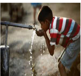
पूर्ण नहीं हो सका है। संवेदक द्वारा पासवान टोला वासियों के घरों तक जलापूर्ति कनेक्शन नहीं दिया गया है। सिर्फ बोरिंग करके छोड़ दिया गया है। पासवान टोला के लोगों को

नवबिहार टाइम्स संवाददाता मदनपुर। मदनपुर प्रखंड अंतर्गत बनियां पंचायत के वार्ड नंबर 14 के बनिया पासवान टोला में नल जल योजना बीते एक वर्ष से आधे अधूरे निर्माणाधीन कार्य छोड़ देने से पेयजल की संकट गहरा गया है। ग्रामीण अन्त्यत्र जगहों से पेयजल लाने को मजबूर है। इस योजना का निर्माण कार्य मेसर्स आर्यन कंस्ट्रक्शन कंपनी को दिया गया था। संवेदक के द्वारा कार्य करवाने में लापारवाही बरतने और शिथिलता बरतने के कारण कार्य