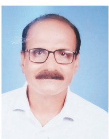
डॉ. मणिमोहन त्रिपाठी

मोदी सरकार के स्वर्णिम 12 वर्ष पूरे हुए और अब तो वह भारत के प्रधानमंत्री पद को सबसे लंबे समय तक सुशोभित करने वाले प्रधानमंत्री बन गए हैं। निश्चित रूप से यह सब राष्ट्र के प्रति उनकी सेवा भावना, दृढ़ इच्छा शक्ति, समर्थ सोच व संस्कार का परिणाम ही तो है। अपने सुशासन के इस कालखंड में उन्होंने समाज के अतिमर्क को खड़े लोगों की सुधि लेकर उनके सर्वांगीण उत्थान के लिए सिर्फ चिंता ही नहीं की वरन् सफल योजनाओं को कार्यन्वित कर सीधे उन तक लाभ भी पहुंचाया है। जो आज भी धरातल पर दिख रहा है। भ्रष्टाचार पर ज़ीरो टॉलरेंस की नीति के कारण ही योजनाओं का लाभ सीधे लाभान्वितों तक पहुंचाने में सफल रहे। तभी तो इस कालखंड में 25 करोड़ लोगों को गरीबी रेखा से बाहर निकाला जा सका। उनके कार्यकाल में गरीब