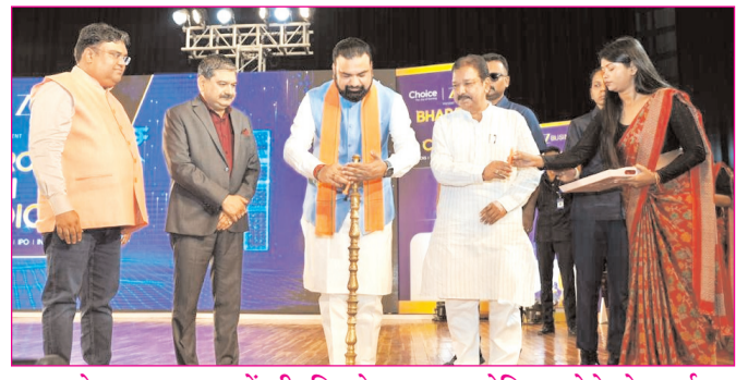
पटना के बापू सभागार में जी. बिजनेस द्वारा आयोजित भरोसे के च्वाइस-पटना के 11वें संस्करण का उद्घाटन करते मुख्यमंत्री सम्राट चौधरी