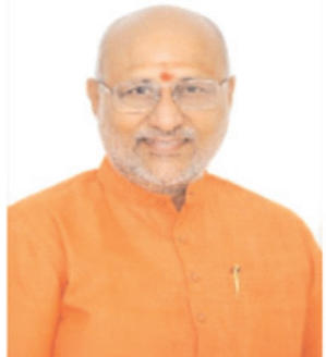
श्री सीपी राधाकृष्णन

भारत ने 10 जून, 2026 को अपने लोकतांत्रिक इतिहास में एक नया अध्याय दर्ज किया। इस रोज श्रीमान नरेन्द्र मोदीजी ने प्रधानमंत्री के रूप में निर्वाह सेवा के 4,399 दिन पूरे कर लिए। इसके साथ ही वह भारत के लगातार सबसे लंबे समय तक पद पर रहने वाले निर्वाचित प्रधानमंत्री बन गए। यह ऐतिहासिक उपलब्धि सिर्फ राष्ट्र निर्माण के लिए उनकी दृढ़ प्रतिबद्धता को ही नहीं दिखाती। यह उनके दूरदर्शी नेतृत्व में भारत के लोगों के अडिग विश्वास और आस्था को भी प्रतिबिंबित करती है। यह उनके दूरदर्शी नेतृत्व, राष्ट्रीय विकास के लिए अर्थक प्रतिबद्धता तथा भारत की अंवाक के कल्याण और आकांक्षाओं प्रति अटूट निष्ठा को प्रतिबिंबित करती है।