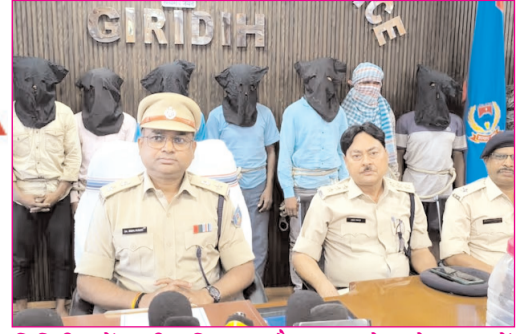
गिरिडीह में जमीन विवाद और जादू-टोना के शक में दंपति की हत्या में शामिल सात आरोपित गिरफ्तार