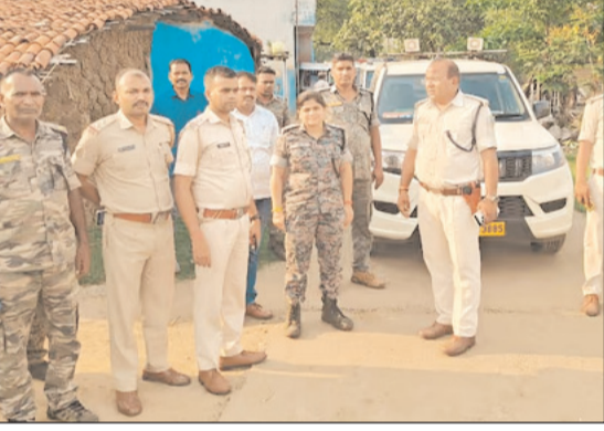
मजबूत किया जा सकेगा। उन्होंने कहा कि लगातार बढ़ रही अपराधिक गतिविधियों पर अंकुश लगाने के लिए पुलिस गंभीरता से कार्रवाई कर रही है। गौरतलब है कि 28 मई की देर रात आकाशकिनारी कैलुडीह इलाके में अवैध खनन के वर्चस्व को लेकर दो गुटों के बीच जमकर हिंसक झड़प हुई थी। इस दौरान दोनों पक्षों की ओर से गोलीबारी और बमबाजी की गई थी जिससे इलाके में दहशत फैल गई थी। इस घटना में दो लोग घायल हो