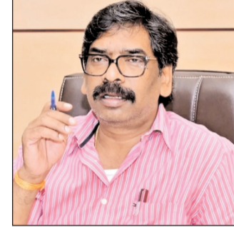
इसके अलावा राज्य में राष्ट्रीय स्तर के वेतनरी कॉलेज, हॉर्टिकल्चर पार्क तथा सहकारी संस्थान की स्थापना के लिए केंद्र से सहयोग मांगने की बात होनी है। कोयला क्षेत्रों में खनन के बाद खाली पड़े भूमि को रैयतों को वापस करने की मांग भी रखेंगे। बताया गया कि नीति आयोग की बैठक में राज्य की शासन प्रणाली में एआइ और डेटा गवर्नेंस के मुद्दे पर भी बात होगी। वहीं सीएम 50 हजार पारा शिक्षकों के मानदेय के लिए केंद्रीय सहायता उपलब्ध कराने की मांग करेंगे।

रांची। प्रधानमंत्री नरेंद्र मोदी की अध्यक्षता में आयोजित होने वाली नीति आयोग गर्वनिंग काउंसिल की 11वीं बैठक में मुख्यमंत्री हेमंत सोरेन 11 जून को हिस्सा लेंगे। बैठक हिस्सा लेने के लिए वह बुधवार को दिल्ली रवाना हो गये हैं। नीति आयोग की यह बैठक युवाओं पर केंद्रित होगी। मुख्यमंत्री राज्य में युवाओं के विकास के लिए किए जा रहे प्रयासों और मिल रही सफलताओं का उल्लेख करेंगे। साथ ही राज्य के विकास, केंद्र से अपेक्षित सहयोग तथा झारखंड की विशेष जरूरतों को प्रमुखता से उठावेंगे। उनके साथ राज्य के वरिष्ठ अधिकारियों का एक प्रतिनिधिमंडल भी बैठक में शामिल होगा। जिसमें मुख्य सचिव, विकास आयुक्त भी हैं। मुख्यमंत्री रांची में मेट्रो रेल परियोजना को स्वीकृत देने तथा रांची, जमशेदपुर, बोकारो-चास, देवघर, गिरिडीह, दुमका और पलामू को नमामि गंगे योजना में शामिल करने का आग्रह भी कर सकते