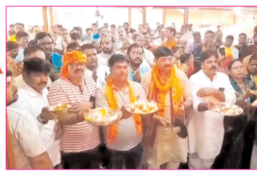
पीएम नेत्र मोदी के नेतृत्व में केंद्र सरकार के 12 साल पूरे होने पर धनबाद में भाजपा नेताओं ने की विशेष पूजा