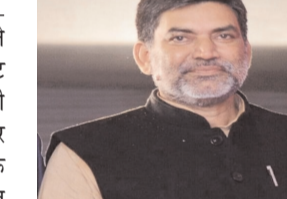
उन्के परिजनों में भारी आक्रोश है साथ ही साथ अभी तक देश के दजनों छात्र आत्महत्या भी कर चुके हैं। नेताओं ने कहा नीट परीक्षा आयोजित करने वाला पत्र टी ए की विश्वसनीयता पर वषों से गंभीर सवाल उठ रहे हैं वहीं दूसरी ओर सी बी एस सी परीक्षा परिणाम में हुई घोर अनियमितता को मीडिया के समक्ष केंद्रीय शिक्षा मंत्री ने स्वीकार करने हेतु इस्तीफे अर्पण एवं सचिव को भी बदलने का काम किया है।