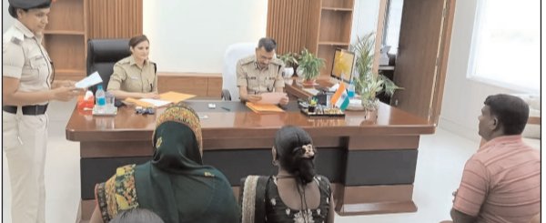
प्रकृति के अनुसार उनके त्वरित, निष्पक्ष एवं प्रभावी निष्पादन हेतु संबंधित पुलिस पदाधिकारियों को आवश्यक दिशा-निर्देश दिए गए तथा सभी मामलों में समयबद्ध कार्रवाई सुनिश्चित करने का निर्देश दिया गया। जनता दरबार के दौरान भूमि विवाद, पारिवारिक विवाद, आपराधिक

अरवल। अपर पुलिस महानिदेशक एवं पुलिस अधीक्षक, अरवल द्वारा संयुक्त रूप से पुलिस कार्यालय, अरवल में आयोजित जनता दरबार में आमजनों की शिकायतों एवं समस्याओं की सुनवाई की गई। जनता दरबार में बड़ी संख्या में फरियादी अपनी विभिन्न समस्याओं, शिकायतों एवं आवेदन पत्रों के साथ उपस्थित हुए। इस अवसर पर अपर पुलिस महानिदेशक एवं पुलिस अधीक्षक द्वारा उपस्थित सभी फरियादियों को संबोधित करके गंभीरतापूर्वक एवं संवेदनशीलता के साथ सुना गया। प्राप्त आवेदनों एवं शिकायतों की