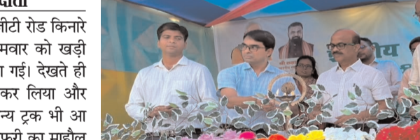
लाभ दिलाने के लिए वैज्ञानिक और जैविक खेती को बढ़ावा देना है। उन्होंने कहा कि खरीफ फसल में धान, अरहर, मक्का, बाजरा, रागी सहित अन्य फसलों के बीज किसानों को उपलब्ध कराया जायेगा। यह अभियान प्रखंड स्तर पर भी चलाया जाएगा और पंचायत स्तर पर कृषि चौपाल का आयोजन कर किसानों को वैज्ञानिक और जैविक खेती के बारे में जानकारी दी जाएगी। उन्होंने किसानों से अपील की कि बीज प्राप्त करने के लिए ऑनलाइन पोर्टल के माध्यम से आवेदन करें।