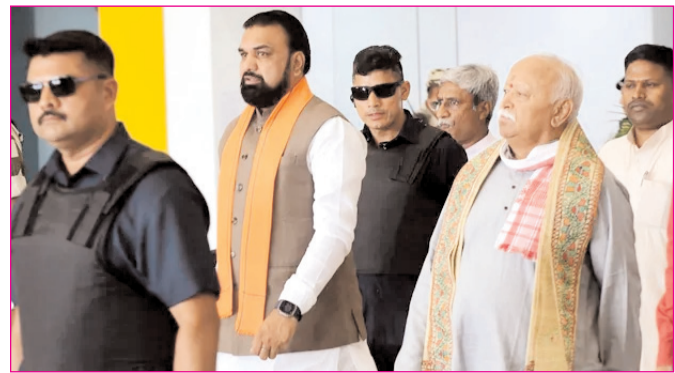
पटना में आरएसएस प्रमुख मोहन भागवत का स्वागत करते मुख्यमंत्री सम्राट चौधरी

* औरंगाबाद, पटना एवं बोकारो से प्रकाशित * www.navbihartime.com