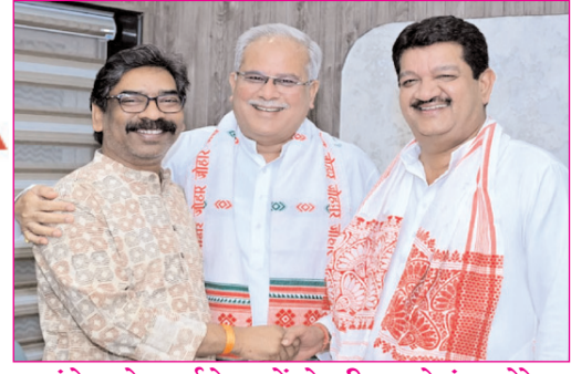
कांग्रेस के पर्यवेक्षकों ने सीएम हेमंत सोरेन से की मुलाकात