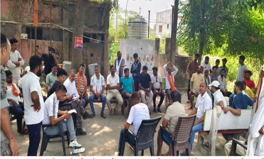
सुबह अस्पताल पहुंचने पर परिजनों ने उसे मृत पाया। परिजनों का दावा है कि मृतक की गर्दन पर चोट के