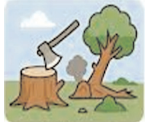
वनों की कटाई