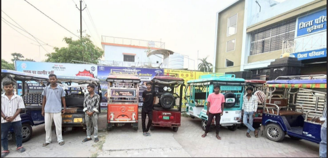
अभियान के क्रम में बिना पंजीकरण एवं नाबालिगों द्वारा वाहन परचालन कुल 12 ई-रिक्शा को जब्त किया गया। इसके अतिरिक्त बिना हेलमेट वाहन चला रहे दोपहिया वाहन चालकों के विरुद्ध भी कार्रवाई करते हुए वाहनों को जब्त किया गया। जांच के दौरान यातायात नियमों के उल्लंघन के मामलों में कुल 47,500 रुपये का जुर्माना अधिरोपित किया गया। जिला प्रशासन द्वारा स्पष्ट किया गया कि सड़क सुरक्षा से जुड़े नियमों का अनुपालन सुनिश्चित करने हेतु इस प्रकार के विशेष जांच अभियान आगे भी निरंतर संचालित किए जाएंगे तथा नियमों के उल्लंघन करने वालों के विरुद्ध नियमानुसार कार्रवाई की जाएगी। इस अभियान में सभी मोटरयान निरीक्षक, औरंगाबाद एवं प्रवर्तन अवर निरीक्षक, औरंगाबाद उपस्थित थे।