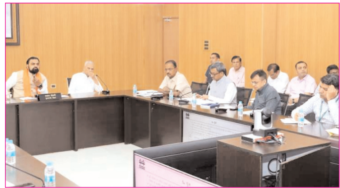
पटना में पथ निर्माण विभाग के अधिकारियों के साथ समीक्षा बैठक करते सीएम सम्राट चौधरी

* मूल्य : 3.00 रुपये * औरंगाबाद, पटना एवं बोकारो से प्रकाशित * www.navbihartime.com