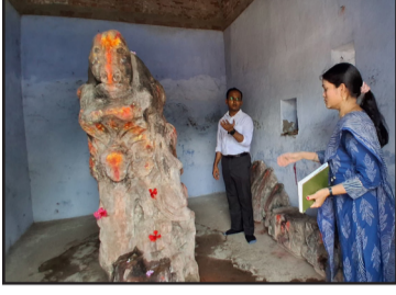
के प्रवेश पर रोक लगाने तथा परिसर की सुरक्षा व्यवस्था सुदृढ़ रखने का निर्देश दिया। जिला पदाधिकारी ने पुरास्थलों की नियमित

साफ-सफाई, सुरक्षा व्यवस्था, सूचना पट्टों की स्थापना तथा पर्यटकों के लिए आवश्यक मूलभूत सुविधाओं की उपलब्धता सुनिश्चित करने का निर्देश दिया। उन्होंने पुरास्थलों के ऐतिहासिक महत्व के व्यापक प्रचार-प्रसार तथा पर्यटन की संभावनाओं को विकसित करने हेतु भी आवश्यक कदम उठाने पर बल दिया। इसके उपरांत जिला पदाधिकारी ने वारिसलीगंज प्रखंड स्थित अपसद तालाब का निरीक्षण किया। निरीक्षण के दौरान उन्होंने तालाब परिसर के संरक्षण एवं सौंदर्यीकरण के लिए आवश्यक कार्ययोजना तैयार करने का निर्देश दिया। साथ ही तालाब के चारों ओर नियमित साफ-सफाई सुनिश्चित करने तथा हाई मास्ट लाइट स्थापित करने का निर्देश संबंधित अधिकारियों को दिया। इसके पश्चात उन्होंने अपसद गांव में स्थित ऐतिहासिक धरोहरों का भी अवलोकन किया तथा संबंधित विभागीय पदाधिकारियों को पुरास्थलों से संबंधित लिंबित कार्यों की समीक्षा कर समयबद्ध निष्पादन सुनिश्चित करने का निर्देश दिया। उन्होंने अतिक्रमण