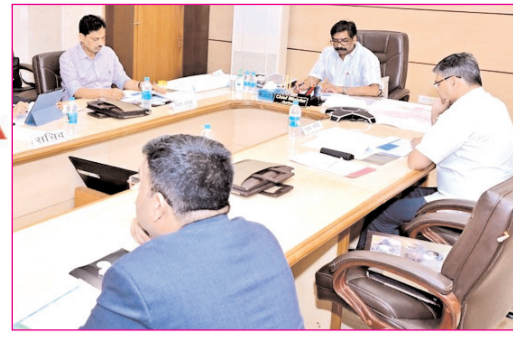
झारखंड मंत्रालय में खान एवं भू-तत्व तथा भवन निर्माण विभाग की उच्चस्तरीय समीक्षा