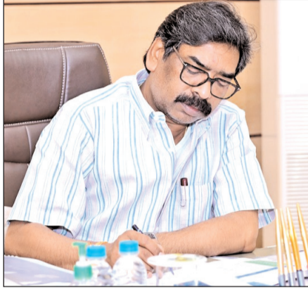
निर्माण कार्यों में पारदर्शिता, गुणवत्ता और समयबद्धता को सर्वोच्च प्राथमिकता दी जाए तथा प्रगति की नियमित समीक्षा की जाए। समीक्षा के दौरान मुख्यमंत्री हेमंत सोरेन ने राज्य में संचालित बीसीसीएल, सीसीएल एवं ईसीएल की बंद पड़ी खदानों को निरस्त करने हेतु प्रक्रिया/सपाय तलाशने का निर्देश दिया। उन्होंने कहा कि जिन खदानों में उत्पादन बंद है, वहां उत्पादन पुनः प्रारंभ

रांची। मुख्यमंत्री हेमंत सोरेन ने बुधवार को झारखंड मंत्रालय में खान एवं भू-तत्व तथा भवन निर्माण विभाग की अद्यतन कार्य प्रगति की उच्च स्तरीय समीक्षा की। इस अवसर पर उन्होंने विभागों द्वारा संचालित विभिन्न योजनाओं, परियोजनाओं तथा लंबित कार्यों की प्रगति का विस्तृत आकलन करते हुए संबंधित अधिकारियों को आवश्यक दिशा-निर्देश दिए। मुख्यमंत्री ने राज्य में अवैध खनन पर कड़ी सख्ती बरतने के निर्देश देते हुए कहा कि इसे हर हाल में रोकना सुनिश्चित किया जाए। उन्होंने स्पष्ट किया कि अवैध खनन से राज्य को राजस्व की हानि होती है। साथ ही यह पर्यावरणीय संतुलन और कानून-व्यवस्था के लिए भी गंभीर चुनौती उत्पन्न करता है। इसलिए इस पर प्रभावी नियंत्रण के लिए विभागीय समन्वय, नियमित निगरानी और सख्त कार्रवाई सुनिश्चित की जाए। इसके साथ ही मुख्यमंत्री ने भवन निर्माण विभाग को निर्देश दिया कि राज्य में संचालित सभी सरकारी भवनों एवं अवसंरचना से जुड़ी परियोजनाओं को निर्धारित समयसीमा के भीतर गुणवत्तापूर्ण तरीके से पूर्ण किया जाए। उन्होंने कहा कि