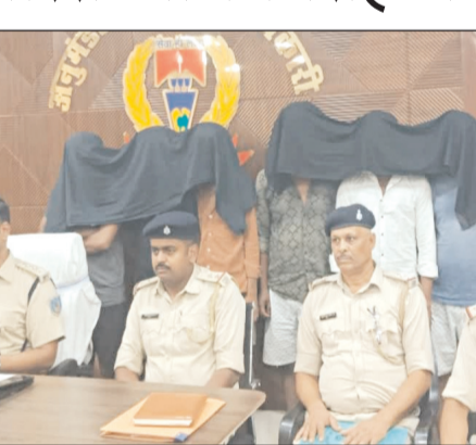
दोनों युवकों को पकड़ लिया। इसके बाद पुलिस को सूचना दे दी। मामले की जांचकर्ता मिलने के बाद नौडीहा बाजार थाना की पुलिस मौके पर पहुंची और दोनों युवकों को हिरासत में लिया। दोनों की निशानदेही पर चार अन्य

मेदिनीनगर। सफाई के नाम पर जेवरात गायब करने वाले इंटर स्टेट गिरोह के छह सदस्यों को पलामू पुलिस ने गिरफ्तार किया है। गिरफ्तार सभी आरोपी बिहार के सुपौल जिला के रहने वाले हैं। यह गिरोह चांदी की सफाई के नाम पर जेवरात को गायब कर देते थे। दरअसल पलामू के नौडीहा बाजार थाना क्षेत्र के हुल्मी गांव में एक महिला बिहार के सुपौल के रहने वाले दो युवकों से चांदी के जेवरात को साफ करवा रही थी। चांदी के जेवर को साफ करवाने के बाद महिला ने सोने का मंगलसूत्र साफ करवाया था। इसी क्रम में दोनों युवकों ने मंगलसूत्र की जगह कागज में पाउडर लपेट कर दे दिया था। महिला जागरूक थी उसने कागज खोलकर देखा और