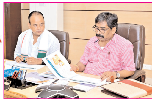
झारखंड मंत्रालय में स्वास्थ्य विभाग की समीक्षा बैठक करते मुख्यमंत्री हेमंत सोरेन