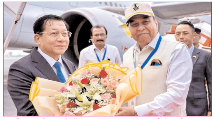
गया में म्यांमार के राष्ट्रपति मिन आंग ह्लाङ्ग का स्वागत करते बिहार के राज्यपाल

* रजि. नंबर : 52290/90 * वर्ष : 37 * अंक : 04 * पृष्ठ : 12 * औरंगाबाद, रविवार, 31 मई 2026 * मूल्य : 3.00 रुपये * औरंगाबाद, पटना एवं बोकारो से प्रकाशित * www.navbihartime.com