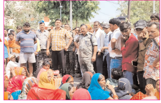
पलामू में पारा शिक्षक की हत्या के विरोध में ग्रामीणों ने किया प्रदर्शन, थाना का किया घेराव