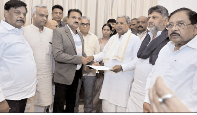
अन्य मंत्रिमंडल सहयोगी मौजूद थे। इस्तीफा सौंपने के बाद सिद्धारमैया ने कहा कि मैंने मुख्यमंत्री पद से इस्तीफा देने का दे दिया है। चूंकि राज्यपाल थावरचंद गहलोत शहर में नहीं हैं, इसलिए मैंने अपना त्यागपत्र उनके विशेष सचिव को