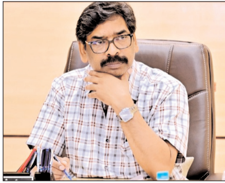
अध्ययनरत छात्र-छात्राओं के परीक्षा परिणाम में निरंतर सुधार हो रहा है, बच्चों का रिजल्ट और ज्यादा अच्छा हो इस निमित्त शिक्षकों के प्रशिक्षण कार्य सहित सभी पहलुओं पर विशेष ध्यान केंद्रित करें। इस दौरान, सीएम सोरेन ने अधिकारियों को निर्देश दिया कि वे

रांची। मुख्यमंत्री हेमंत सोरेन की अध्यक्षता में मंगलवार को झारखंड मंत्रालय में स्कूली शिक्षा एवं साक्षरता विभाग की अद्यतन कार्य प्रगति की समीक्षा बैठक संपन्न हुई। बैठक में सीएम ने अधिकारियों को विभाग द्वारा संचालित योजनाओं, विद्यालयों में शैक्षणिक व्यवस्थाएं, आधारभूत संरचनाओं तथा विद्यार्थियों को उपलब्ध कराई जा रही सुविधाओं की विस्तृत समीक्षा की। सीएम ने अधिकारियों को निर्देश दिया कि राज्य सरकार द्वारा विद्यालयों से जुड़ी योजनाओं एवं कार्यक्रमों को प्रभावी तरीके से पारदर्शिता के साथ अद्यतन छात्र-छात्राओं तक ससमय पहुंचाना सुनिश्चित करें। मुख्यमंत्री ने अधिकारियों से कहा कि राज्य सरकार झारखंड के बच्चों को बेहतर और क्वालिटी एजुकेशन प्रदान करने के लिए प्रतिबद्ध है। सीएम सोरेन ने कहा कि सरकारी विद्यालयों में