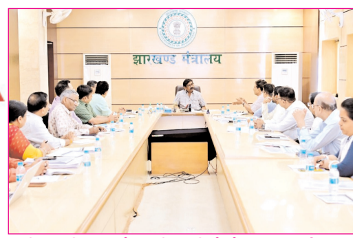
शिक्षा विभाग के अधिकारियों के साथ समीक्षा बैठक करते मुख्यमंत्री हेमंत सोरेन