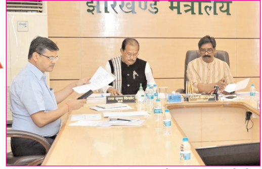
वित्त एवं वाणिज्य-कर विभाग के अधिकारियों के साथ समीक्षा बैठक करते सीएम हेमंत सोरेन