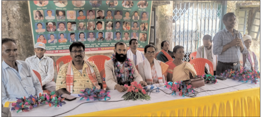
आत्मदाह किया जाएगा।