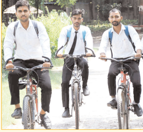
प्रतिशत तक की वृद्धि हुई है। बाजार में सबसे अधिक मांग 10 हजार से 35 हजार रुपये तक की प्रीमियम और स्पोर्ट्स साइकिलों की है। व्यापारियों का मानना है कि कोरोना महामारी के बाद लोग जिम और महंगे फिटनेस

करने तथा पर्यावरण संरक्षण में योगदान देने की अपील की है। अब साइकिल केवल बच्चों या ग्रामीण इलाकों तक सीमित नहीं रह गई है बल्कि यह शहरी युवाओं की आधुनिक लाइफस्टाइल का हिस्सा बनती जा रही है। कॉलेज जाने वाले छात्र, नौकरीपेशा युवा, फिटनेस प्रेमी और वरिष्ठ नागरिक भी नियमित रूप से साइकिलिंग को अपनी दिनचर्या में शामिल कर रहे हैं। बिहार की राजधानी पटना, गया, मुजफ्फरपुर, औरंगाबाद, सासाराम, भागलपुर और दरभंगा जैसे शहरों में सुबह के समय साइकिल चालकों की संख्या लगातार बढ़ रही है। पटना के गांधी मैदान, मरीन ड्राइव और इको पार्क के आसपास सुबह-शाम युवाओं के कई समूह सामूहिक 'साइकिल चालन' का आयोजन कर रहे हैं। साइकिल कारोबारियों के अनुसार युवाओं के बीच सामान्य साइकिलों की तुलना में स्पोर्ट्स, गियर और माउंटन बाइक की मांग तेजी से बढ़ी है। पटना के स्टेशन रोड स्थित एक प्रमुख शोरूम संचालक ने बताया कि पिछले एक वर्ष में साइकिलों की बिक्री में करीब 30