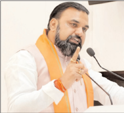
लेकर इसमें लगातार सुधार किए जाएंगे। उन्होंने कहा कि अगर उद्योग जगत को किसी नीति में बदलाव की जरूरत महसूस होती है तो वे सीधे उद्योग मंत्री से मिल सकते हैं। सरकार कारोबारियों के सुझावों के आधार पर नई नीतियां बनाने के लिए तैयार है। मुख्यमंत्री ने कहा

पटना। बिहार में उद्योग और निवेश को बढ़ावा देने के लिए राज्य सरकार अब बड़े स्तर पर काम करने की तैयारी में है। बिहार चैंबर ऑफ कॉमर्स एंड इंडस्ट्रीज द्वारा आयोजित व्यवसायिक समागम के अंतिम दिन मुख्यमंत्री सम्राट चौधरी ने उद्योग, निवेश और इंफ्रास्ट्रक्चर को लेकर कई बड़ी घोषणाएं कीं। मुख्यमंत्री ने कहा कि बिहार में उद्योग लगाने वाले कारोबारियों की सुरक्षा और समस्याओं के समाधान के लिए सरकार पूरी तरह गंभीर है। इसके लिए हर तीन महीने पर जिला स्तर पर बैठक आयोजित की जाएगी। इस बैठक में डीएम, एसपी और उद्योग जगत के प्रतिनिधि शामिल होंगे ताकि व्यापारियों की समस्याओं का जल्दी समाधान हो सके। श्री चौधरी ने कहा कि बिहार में उद्योगों के लिए अनुकूल माहौल तैयार किया जा रहा है। राज्य सरकार ने औद्योगिक निवेश प्रोत्साहन नीति-2025 लागू की है और उद्योग संगठनों से सुझाव