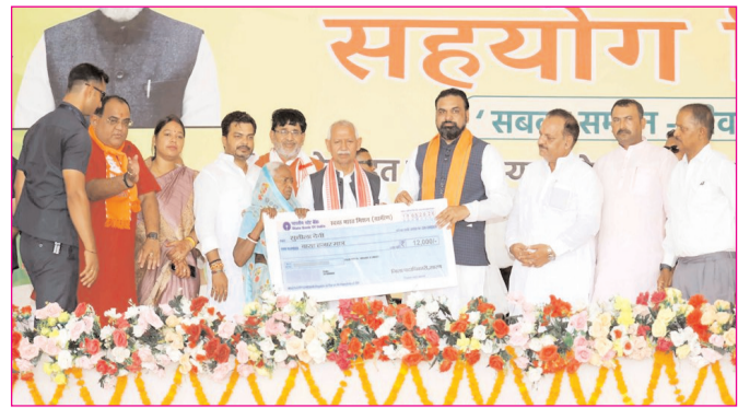
सोनपुर में आयोजित सहयोग शिविर में विभिन्न योजना को लाभार्थियों को चेक प्रदान करते सीएम सम्राट चौधरी

* पटना संस्करण * रजि. नंबर : 52290/90 * वर्ष : 36 * अंक : 350 * पृष्ठ : 12 * औरंगाबाद, बुधवार, 20 मई 2026 * मूल्य : 3.00 रुपये * औरंगाबाद, पटना एवं बोकारो से प्रकाशित * www.navbihartime.com