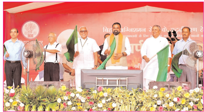
पटना के गांधी मैदान से अग्निशमन बाहनों को खाना करते सीएम सम्राट चौधरी, डिप्टी सीएम विजय कुमार चौधरी एवं अन्य