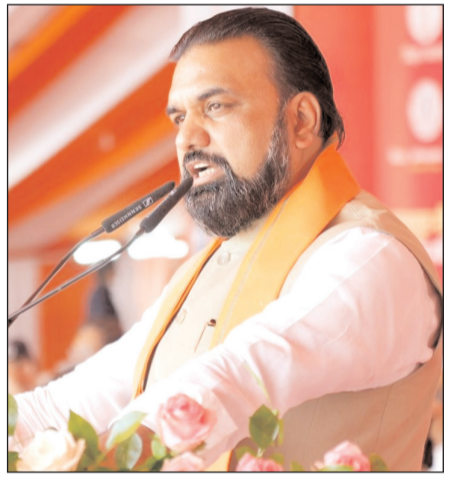
कहा कि बिहार में सुशासन कायम है और पुलिस को पूरी स्वतंत्रता दी गई है। उन्होंने स्पष्ट कहा कि राज्य में कोई भी व्यक्ति कानून को हाथ में नहीं ले सकता और पुलिस लगातार अपराधियों को जवाब दे रही है।

नवबिहार टाइम्स ब्यूरो पटना। मुख्यमंत्री सम्राट चौधरी ने सोमवार को राजधानी पटना के गांधी मैदान में 80 अत्याधुनिक अग्निशमन वाहनों और एआई आधारित आधुनिक अग्निशमन नियंत्रण कक्ष का लोकार्पण किया। इस अवसर पर मुख्यमंत्री ने कहा कि बिहार अब सड़क, बिजली और मूलभूत सुविधाओं से आगे बढ़कर औद्योगिक विकास की दिशा में तेजी से आगे बढ़ रहा है। उन्होंने बिहार से बाहर उद्योग स्थापित कर चुके उद्यमियों से अपील करते हुए कहा कि वे अपनी जन्मभूमि बिहार लौटें और यहां निवेश कर राज्य को समृद्ध बनाने में योगदान दें। मुख्यमंत्री ने कहा कि राज्य में बड़े-बड़े उद्योगपति आगे आ रहे हैं। उनकी सरकार को अभी एक महीना और तीन दिन हट्ट हैं लेकिन इस दौरान बिहार से बाहर गए कई उद्यमियों ने वापस लौटकर निवेश करने की इच्छा जताई है। उन्होंने कहा कि 20 नवंबर 2026 को एनडीए सरकार के एक वर्ष पूरा होने तक बिहार में पांच लाख करोड़ रुपये के निवेश पर काम शुरू कराने का लक्ष्य है। मुख्यमंत्री ने