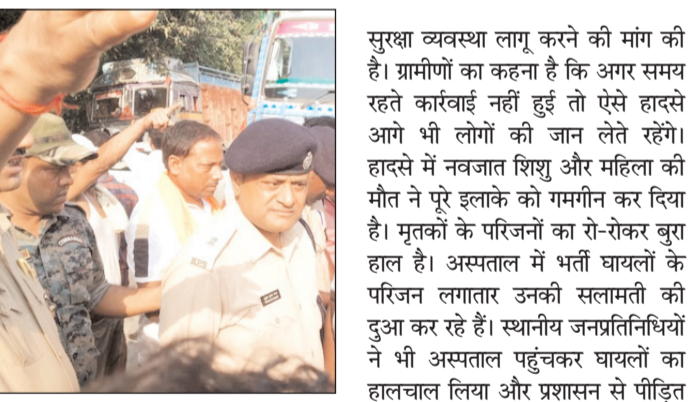
आसपास के ग्रामीण मौके पर पहुंचे और ऑटो में फंसे लोगों को बाहर निकालने लगे। घायलों को आनन-फानन में नजदीकी अस्पताल पहुंचाया गया। डॉक्टरों ने कई घायलों की हालत बेहद गंभीर बताई है और बेहतर इलाज के लिए रेफर करने की तैयारी की जा रही है। वहीं पुलिस ने मृतकों के शव को कब्जे में लेकर पोस्टमार्टम के लिए भेज दिए हैं। घटना की सूचना मिलते ही

नवबिहार टाइम्स ब्यूरो खगड़िया। जिले के मानसी थाना क्षेत्र अंतर्गत एनएच-31 पर सोमवार को हुए भीषण सड़क हादसे ने पूरे इलाके को झकझोर कर रख दिया है। ठठा गांव के पास तेज रफ्तार ट्रक और ऑटो की आमने-सामने टक्कर में सात लोगों की दर्दनाक मौत हो गई जबकि चार लोग गंभीर रूप से घायल हो गए। हादसे में दो माह का नवजात, एक महिला और एक बालक की मौत ने लोगों को भावुक कर दिया। घटना के बाद सड़क पर अफरा-तफरी और चीख-पुकार का माहौल बन गया। प्रत्यक्षदर्शियों के अनुसार ऑटो सवार लोग किसी जरूरी काम से जा रहे थे। इसी दौरान सामने से तेज रफ्तार में आ रहे ट्रक ने ऑटो में सीधी टक्कर मार दी। टक्कर इतनी जबरदस्त थी कि ऑटो के परखच्चे उड़ गए और कई लोगों की मौके पर ही मौत हो गई। सड़क पर शव और घायलों को पड़ा देख स्थानीय लोग दहशत में आ गए। हादसे के तुरंत बाद