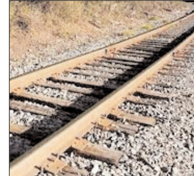
प्रशासनिक स्वीकृति और निर्माण प्रक्रिया में तेजी आने की संभावना है। इससे लंबे समय से फाइलों में अटकती परियोजना को गति मिलेगी।

जोड़ने की मांग करते रहे हैं। कई पीढ़ियां इस उम्मीद में गुजर गई कि कभी गया से शेरघाटी, इमामगंज होते हुए पलामू तक रेल चलेगी। अब पहली बार यह सपना धरातल पर उतरता दिखाई दे रहा है। प्रस्तावित रेल लाइन गया जिले के परैया, गुरुआ, शेरघाटी, बांकेबाजार, इमामगंज, डुमरिया और झारखंड के मैगरा, नौडीहा बाजार होते हुए डाल्टनगंज तक पहुंचने की परिकल्पना के रूप में देखी जा रही है। वर्तमान अधिसूचना में परैया से चतरा तक के हिस्से को विशेष परियोजना घोषित किया गया है, जिसे आगे पलामू क्षेत्र से जोड़ने की दिशा में महत्वपूर्ण कदम माना जा रहा है। रेलवे (संशोधन) अधिनियम, 2008 के तहत विशेष रेल परियोजना घोषित होने के बाद भूमि अधिग्रहण,