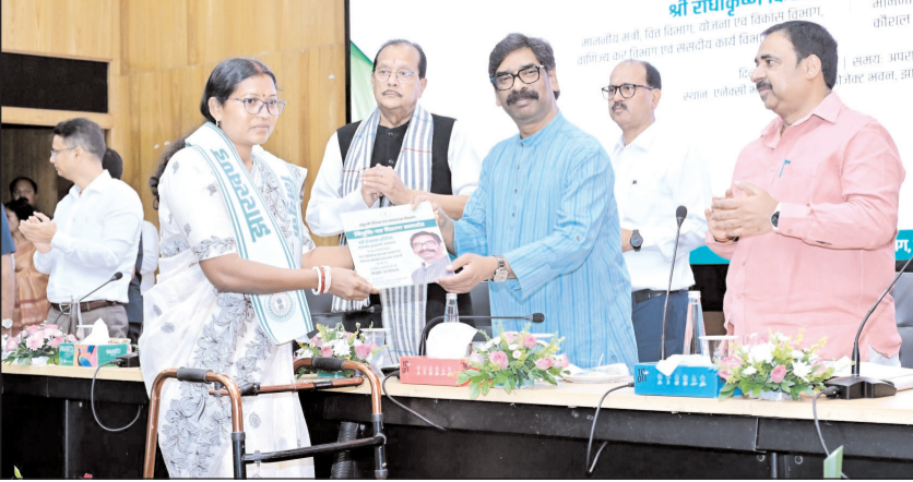
नहीं बल्कि झारखंड के समग्र विकास को ध्यान में रखते हुए नियुक्तियां कर रही है। हेमंत सोरेन ने

नवबिहार टाइम्स ब्यूरो रांची। मुख्यमंत्री हेमंत सोरेन ने सोमवार को प्रोजेक्ट भवन में आयोजित कार्यक्रम में 319 शिक्षकों और 17 महिला पर्यवेक्षिकाओं को नियुक्ति पत्र सौंपे। इस दौरान मुख्यमंत्री ने कहा कि राज्य सरकार आने वाले दो से चार महीनों में हजारों नई नियुक्तियां करने जा रही है। मुख्यमंत्री ने कहा कि सरकार बनने के बाद से ही मानव संसाधन के क्षेत्र में नियुक्ति प्रक्रिया को तेजी दी गई है। उन्होंने बताया कि पिछले चार महीनों में शिक्षा विभाग में करीब 9 हजार शिक्षकों की नियुक्ति की जा चुकी है। नियुक्ति पत्र पाने वाले सभी अस्थायी इंटर और स्नातक प्रशिक्षित सहायक आचार्य हैं। कार्यक्रम के दौरान मुख्यमंत्री ने युवाओं को संबोधित करते हुए कहा कि सरकार केवल रोजगार देने के उद्देश्य से