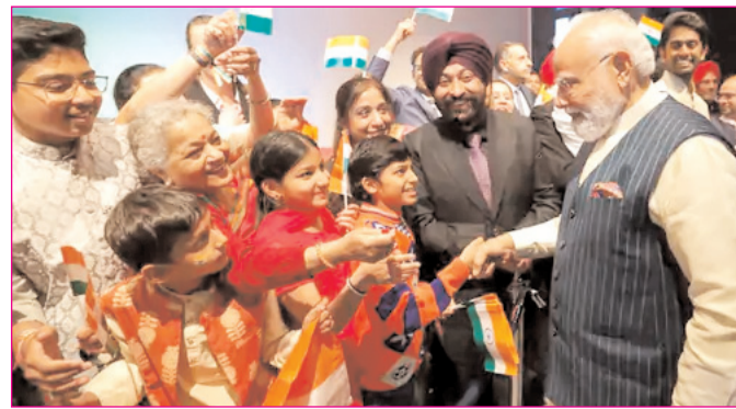
नौदरलैंड में भारतीय मूल के लोगों से मिलते प्रधानमंत्री नरेन्द्र मोदी

संक्षिप्त समाचार फर्जी प्रमाण पत्र पर बहाल आधा दर्जन शिक्षक बर्खास्त