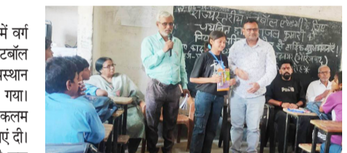
नवबिहार टाइम्स संवाददाता