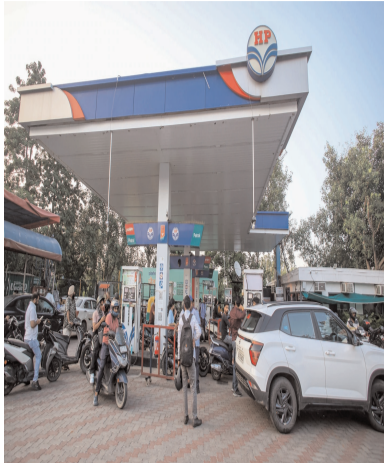
रहा। कई पंप बंद रहे, जबकि खुले पंपों पर तेल लेने वालों की भारी भीड़ जुटी रही। पेट्रोल नहीं मिलने से कई जगहों पर तनावपूर्ण स्थिति उत्पन्न

नवबिहार टाइम्स संवाददाता धनबाद। ईरान-अमेरिका तनाव के बीच पेट्रोल-डीजल संकट की अफवाह का असर धनबाद कोयलांचल में साफ दिखने लगा है। गुरुवार शाम यह खबर फैलते ही कि पेट्रोल-डीजल का स्टॉक खत्म होने वाला है, शहर के अधिकांश पेट्रोल पंपों पर भारी भीड़ उमड़ पड़ी। हीरापुर, धैया, बैंक मोड़, सरायदेला, मेमको और लोहा बिल्डिंग क्षेत्र के पेट्रोल पंपों पर वाहनों की लंबी कतारें लग गईं, जिससे कई जगह जाम की स्थिति बन गई। लोगों को घंटों इंतजार करना पड़ा। भीड़ बढ़ने और हंगामे की आशंका को देखते हुए कई पेट्रोल पंप संचालकों ने पेट्रोल-डीजल देना बंद कर दिया। सुबह से भी शहर में अफरातफरी का माहौल बना