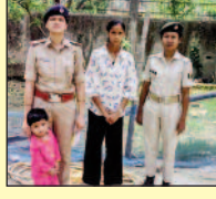
अनुमंडल पदाधिकारी के द्वारा दोनों ही पंचायत का स्थलीय भ्रमण कर उपस्थित पदाधिकारियों को अभी तक प्राप्त आवेदनों का सत प्रतिशत निष्पादन कर देने का निर्देश दिया गया ताकि शिविर के पहले ही आवेदनों का निष्पादन सुनिश्चित हो जाए।