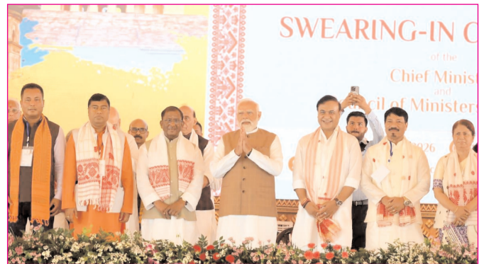
असम में मुख्यमंत्री हिमंत बिस्वा सरमा एवं अन्य मंत्रियों के साथ प्रधानमंत्री नरेन्द्र मोदी

* औरंगाबाद, पटना एवं बोकारो से प्रकाशित * www.navbihartime.com