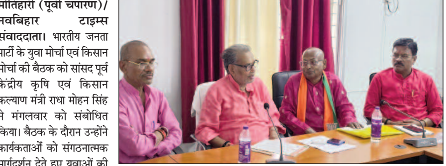
से की गई सामूहिक भागीदारी की अपील का समर्थन करते हुए कहा गया कि कठिन वैश्विक परिस्थितियों में सभी नागरिकों को जिम्मेदारी के साथ सहयोग करना चाहिए। उन्होंने लोगों से स्थानीय उपायों को बढ़ावा देने, अनावश्यक खर्चों से बचने तथा आत्मनिर्भर भारत की भावना को मजबूत करने की अपील की। उन्होंने कहा कि युवा मोर्चा और किसान मोर्चा के कार्यकर्ता मंडलों में सक्रियता से कार्य करेंगे। उन्होंने इलेक्ट्रिक वाहन को खरीदने और उसका उपयोग करने की बात कही ताकि पेट्रोल और डीजल