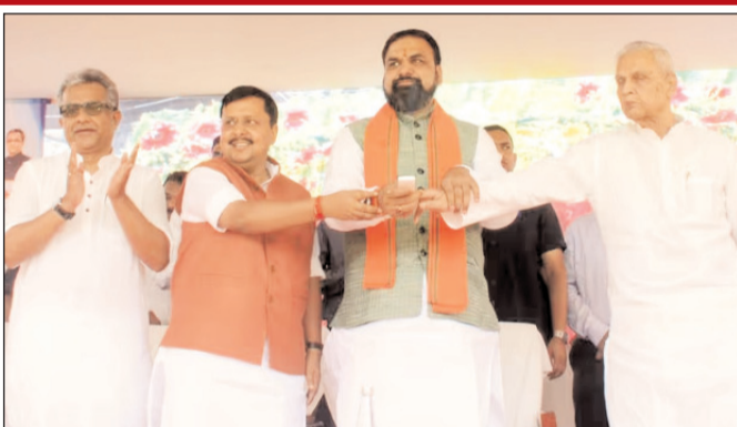
किए और श्रद्धांजलि दी। हालांकि सबसे बड़ा आयोजन मंदिरी इलाके में नई सड़क के उद्घाटन का रहा जहां बड़ी संख्या में लोग मौजूद रहे। समारोह में नितिन नवीन ने कहा कि यह सड़क उनके ड्रीम प्रोजेक्ट्स में से एक थी। उन्होंने बांकीपुर विधायक रहते हुए इस योजना को आगे बढ़ाने के लिए लगातार

पटना। राजधानी पटना को आज एक बड़ी सौगात मिली। मुख्यमंत्री सम्राट चौधरी ने मंदिरी नाले पर बनी नई सड़क का उद्घाटन किया। इस सड़क का नाम भाजपा के वरिष्ठ नेता और बिहार के पूर्व विधायक रहे नवीन किशोर प्रसाद सिन्हा के नाम पर रखा गया है। अब यह सड़क नवीन किशोर सिन्हा पथ के नाम से जानी जाएगी। इस मौके पर भाजपा के राष्ट्रीय अध्यक्ष नितिन नवीन, उपमुख्यमंत्री बिजेंद्र प्रसाद यादव समेत कई नेता और अधिकारी मौजूद रहे। कार्यक्रम के दौरान नितिन नवीन अपने पिता को याद कर भावुक हो गए। आज नवीन किशोर सिन्हा की 77वीं जयंती थी। इस अवसर पर पटना में कई कार्यक्रम आयोजित किए गए। नितिन नवीन ने नवीन सिन्हा पार्क पहुंचकर अपने पिता की प्रतिमा पर पुष्प अर्पित