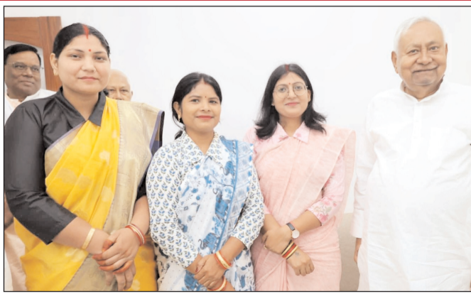
प्रदर्शन करने का प्रयास करेगी। उन्होंने कहा कि पार्टी संगठन को बूथ स्तर तक मजबूत बनाने के लिए लगातार अभियान चलाया जाएगा। उन्होंने बताया कि वह जल्द ही उत्तर प्रदेश के पूर्वांचल सहित उन जिलों का दौरा करेंगे, जहां

पटना। उत्तर प्रदेश में जनता दल यूनाइटेड के संगठन को मजबूत करने और आगामी विधानसभा चुनाव में प्रभावी भूमिका निभाने की तैयारी तेज हो गई है। इसी कड़ी में उत्तर प्रदेश से आए जनता दल यूनाइटेड के नेताओं और महिला कार्यकर्ताओं के प्रतिनिधिमंडल ने सोमवार को जदयू के राष्ट्रीय अध्यक्ष नीतीश कुमार तथा उत्तर प्रदेश प्रभारी और बिहार सरकार के मंत्री श्रवण कुमार से मुलाकात की। बैठक में संगठन विस्तार, जनाधार मजबूत करने और चुनावी रणनीति को लेकर विस्तार से चर्चा हुई। श्रवण कुमार ने कहा कि उत्तर प्रदेश में जनता दल यूनाइटेड का अच्छा जनाधार है और पार्टी आगामी विधानसभा चुनाव में राष्ट्रीय जनतांत्रिक गठबंधन के साथ मिलकर बेहतर