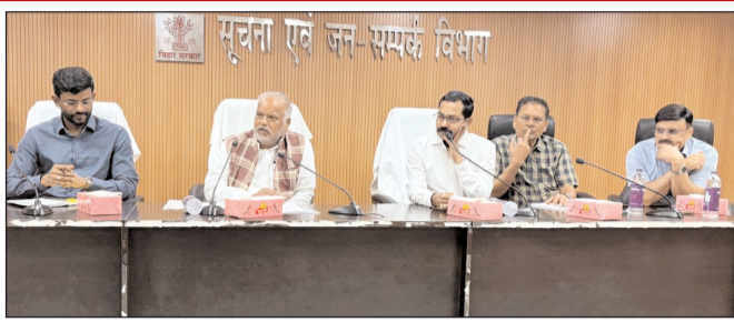
अवसर मिला और अब मुख्यमंत्री सम्राट चौधरी ने नेतृत्व वाली नई कैबिनेट में भी उन्हें दायित्व सौंपा गया है। उन्होंने कहा कि विश्वास जताया कि नीतीश कुमार के नेतृत्व में जो विकास की मजबूत नींव रखी गई, नई सरकार उसे और अधिक गति और मजबूती देगी। उन्होंने कहा कि जनता की अपेक्षाओं पर खरा उतरते हुए