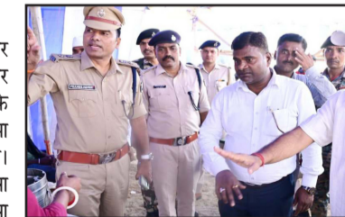
होने के कारण सभी तरह का आवागमन बंद है। इसके मद्देनजर जिला प्रशासन के द्वारा वैकल्पिक यातायात व्यवस्था के तहत भागलपुर से नगछिया और वहां से भागलपुर आने के लिए बड़ी संख्या में सरकारी और निजी नावों का परिचालन किया जा रहा है। इसके अलावा स्टीमर की भी व्यवस्था की गई है। प्रतिदिन यात्रियों की भारी भीड़ को देखते हुए बरारी घाट और नगछिया की ओर के घाट पर अस्थायी प्रतिष्ठा टेंट, जीविका की रसोई घर, चिकित्सा शिविर आदि स्थापित किये गये हैं। जबकि सुरक्षा के मद्देनजर दोनों घाटों पर अस्थायी थाना खोला गया है। वहां पर दंडाधिकारियों के देखरेख में पुलिस बल की तैनाती की गई है।

नवबिहार टाइम्स संवाददाता भागलपुर। जिलाधिकारी डॉ. नवल किशोर चौधरी एवं वरीय पुलिस अधीक्षक प्रमोद कुमार यादव ने आज क्षतिग्रस्त विक्रमशिला सेतु के पास बरारी घाट पहुंचकर यात्रियों की सुविधा हेतु की गई व्यवस्थाओं का निरीक्षण किया। निरीक्षण के दौरान जिलाधिकारी ने नाव से यात्रा कर रहे लोगों से बातचीत कर किराया व्यवस्था के संबंध में फीडबैक प्राप्त किया। तत्पश्चात जिलाधिकारी एवं वरीय पुलिस अधीक्षक ने वहां पर स्थापित अस्थायी थाना का भी मुआयना किया और सुरक्षा एवं विधि-व्यवस्था की स्थिति की समीक्षा की। साथ ही दोनों वरीय अधिकारियों द्वारा जीविका दीवियों के संचालित रसोई घर में भोजन की गुणवत्ता का निरीक्षण करने के बाद प्रतीक्षा शिविर में यात्रियों की सुविधा के लिए मेट विछाने का निर्देश संबंधित पदाधिकारियों को दिया गया। इस मौके पर संबंधित विभागों के पदाधिकारी एवं कर्मी उपस्थित थे। मालूम हो कि विगत दिनों गंगादीप पर देखेख में पुलिस बल की तैनाती की गई है।