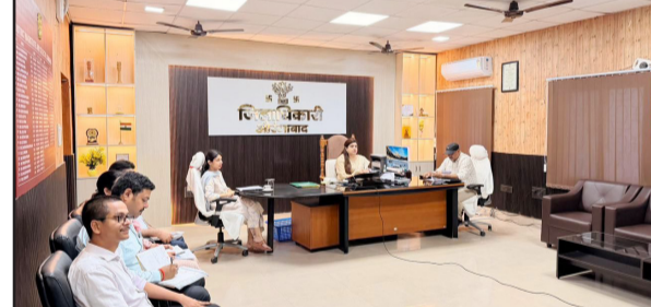
शेष किसानों को भी शीघ्र अभियान से जोड़ने का लक्ष्य निर्धारित किया गया है। मुख्य सचिव द्वारा किसान रजिस्ट्री के कार्य को अभियान मोड में संचालित करने का निर्देश दिया गया है, जिले को निर्धारित लक्ष्य के अनुरूप शत-प्रतिशत फार्मर आईडी निर्माण सुनिश्चित करने का निर्देश दिया गया। बैठक में बताया गया कि ऐसे सभी किसानों का प्राथमिकता के आधार पर पंजीकरण किया जाएगा, जो अब तक किसान रजिस्ट्री में शामिल नहीं हो सके हैं। साथ ही बटाईदार, किरायेदार किसान एवं वास्तविक खेती करने वाले कृषकों को भी किसान रजिस्ट्री में शामिल करने हेतु आवश्यक मानक संचालन प्रक्रिया (एसओपी) जारी की जाएगी। इसके अतिरिक्त सभी शेष भूमि खंडों को फार्मर आईडी से जोड़ने की कार्रवाई भी की जाएगी, जिससे भूमि एवं किसान से संबंधित अभिलेखों का समुचित डिजिटलीकरण सुनिश्चित हो सके। मुख्य सचिव द्वारा प्रतिदिन प्रखंड स्तर पर पंचायत स्तर पर प्रगति की समीक्षा करने तथा गांवों में व्यापक जन-जागरूकता अभियान चलाने का निर्देश दिया गया। मुख्य सचिव ने फरीगंज थाना, गोहा थाना, उपहरा थाना, कासमा थाना, पौथु थाना एवं बंदिया थाना के लंबित मामलों की विस्तारपूर्वक समीक्षा की गई। समीक्षा के दौरान एसपी ने सभी थानाध्यक्षों को लंबित कांडों का शीघ्र एवं निष्पक्ष निष्पादन सुनिश्चित करने का निर्देश दिया। उन्होंने कहा कि अनुसंधान में किसी प्रकार की लापरवाही बर्दाश्त नहीं की जाएगी तथा गंभीर मामलों में त्वरित कार्रवाई की जाए। फरार अभियुक्तों की गिरफ्तारी, जॉर एवं कुर्की के निष्पादन, शराबबंदी, साइबर अपराध तथा भूमि विवाद से जुड़े मामलों पर विशेष ध्यान देने का निर्देश भी दिया गया। एसपी ने कहा कि आम जनता की समस्याओं का त्वरित समाधान पुलिस की प्राथमिकता होनी चाहिए। थाना स्तर पर प्राप्त आवेदनों का समय पर निष्पादन किया जाए तथा