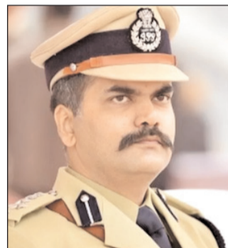
वसुली जैसे मामलों में जीरो टॉलरेंस नीति अपनाई जाएगी। मगध प्रखंड में अपराध नियंत्रण को सर्वोच्च प्राथमिकता देते हुए आईजी ने विशेष रूप से संपत्ति संबंधी अपराधों पर सख्त कार्यवाही के निर्देश दिए हैं। इसके साथ ही रात्रि गश्ती को मजबूत करने, भूमि विवादों में निष्पक्ष पुलिस कार्यवाही सुनिश्चित करने, लंबित मामलों का तेजी से निष्पादन करने और अतिक्रमण व यातायात समस्याओं के समाधान पर भी जोर दिया गया है। आईजी ने अवैध शराब कारोबार और गैरकानूनी सड़क जाम के खिलाफ भी कठोर कार्यवाही के निर्देश दिए हैं। उन्होंने साफ कहा कि सड़क जाम (शेष पृष्ठ 10 पर)