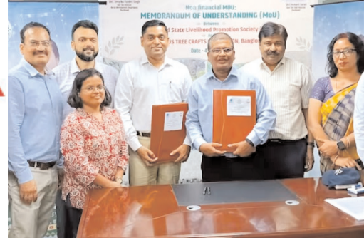
झारखंड स्टेट लाइवलीहुड प्रमोशन सोसाइटी और इंडस्ट्री फाउंडेशन के बीच ऐतिहासिक समझौता