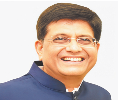
श्री पीयूष गोयल