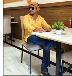
कुशल नेतृत्व के साथ निर्वहन करते हुए संगठन को नई ऊर्जा और दिशा प्रदान करेंगे। भारतीय सेवा दल ने उम्मीद जताई है कि इनके नेतृत्व में