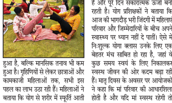
हुआ है, बल्कि मानसिक तनाव भी कम हुआ है। गृहिणियों से लेकर छात्राओं और कामकाजी महिलाओं तक, सभी इस पहल का लाभ उठा रही हैं। महिलाओं ने बताया कि योग से शरीर में स्पृष्टि आती

रूप से स्वयं को स्वस्थ एवं ऊर्जावान बना रही हैं। सुबह की ताजी हवा और हरियाली के बीच आयोजित होने वाली इस योगा क्लास में महिलाओं को विभिन्न योगासन, प्राणायाम, ध्यान और स्वास्थ्य संबंधी महत्वपूर्ण जानकारियां दी जाती हैं। प्रशिक्षकों द्वारा सरल और प्रभावी तरीके पर यह पहल महिलाओं के लिए प्रेरणा और स्वास्थ्य जागरूकता का प्रतीक बनकर सामने आई है। बड़ी संख्या में महिलाएं और युवतियां इस योगा क्लास में शामिल होकर शारीरिक और मानसिक