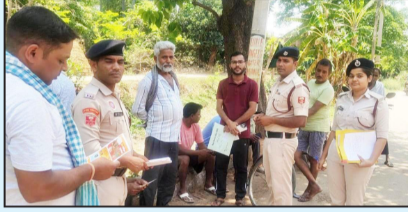
उपस्थिति में ग्रामीणों को आग लगने पर बरती जाने वाली सावधानियों के बारे में बताया गया। इसके पश्चात टीम वैश्यानी क्लिनिक में अग्निशमन उपकरणों के संचालन का प्रदर्शन किया गया। साथ ही, संसा पंचायत के वार्ड संख्या - 10 में स्थानीय वार्ड सदस्यों और जीविका दीदियों के साथ विशेष बैठक कर उन्हें 'अग्नि सखी' के रूप में जागरूक रहने के लिए प्रेरित किया गया। इस दौरान अग्निशमन विभाग की टीम ने