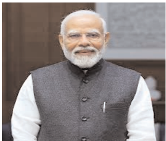
नरेन्द्र मोदी प्रधानमंत्री, भारत जय सोमनाथ !

वर्ष 2026 की शुरुआत में मुझे सोमनाथ स्वाभिमान पर्व में मुमिम्तिल होने का सौभाग्य मिला। यह सोमनाथ मंदिर पर हुए पहले आक्रमण के एक हजार वर्ष बाद भी मंदिर के शाश्वत और अविनाशी होने का पर्व था। अब 11 मई को मुझे एक बार फिर सोमनाथ जाने का सुअवसर प्राप्त हो रहा है। इस बार यह यात्रा पुनर्निर्मित सोमनाथ मंदिर के लोकार्पण की 75वीं वर्षगांठ के उपलक्ष्य में है। मैं उस क्षण को फिर जीने जा रहा हूँ जब भारत के प्रथम राष्ट्रपति डॉ. राजेंद्र प्रसाद जी ने मंदिर का लोकार्पण किया था। उस दिन, सोमनाथ में विध्वंस से सृजन तक की यात्रा फिर से जीवंत होगी। छह महीनों के भीतर सोमनाथ के इतिहास से जुड़े इन दो अत्यंत महत्वपूर्ण पड़ावों का साक्षी बनना मेरे लिए बहुत सौभाग्य की बात है।