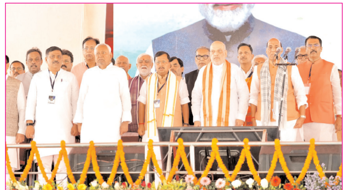
पटना के गांधी मैदान में सम्राट कैबिनेट की विस्तार के मौके पर उपस्थित गणमान्य लोग

* पटना संस्करण * रजि. नंबर : 52290/90 * वर्ष : 36 * अंक : 338 * पृष्ठ : 12 * औरंगाबाद, शुक्रवार, 8 मई 2026 * मूल्य : 3.00 रुपये * औरंगाबाद, पटना एवं बोकारो से प्रकाशित * www.navbihartime.com