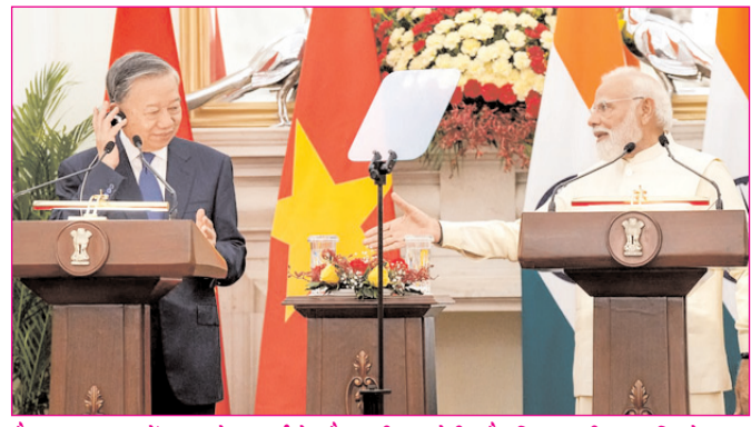
हेराराबाद हाउस में साइज़ा प्रेस वार्ता के दौरान पीएम मोदी और बिजयनामी राष्ट्रपति तो लाम

* रजि. नंबर : 52290/90 * वर्ष : 36 * अंक : 337 * पृष्ठ : 12 * औरंगाबाद, गुरुवार, 7 मई 2026 * मूल्य : 3.00 रुपये * औरंगाबाद, पटना एवं बोकारो से प्रकाशित * www.navbihartime.com