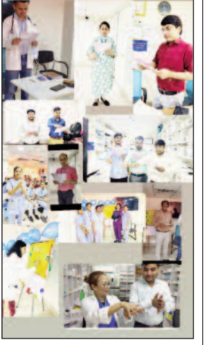
के लिए प्रबंधन ने सभी प्रतिभागियों का आभार व्यक्त किया।

पटना/नवबिहार टाइम्स ब्यूरो। बिग अपोलो स्पेक्ट्र हॉस्पिटल में विश्व हाथ स्वच्छता दिवस पर भव्य कार्यक्रम का आयोजन हुआ। बिग अपोलो स्पेक्ट्र हॉस्पिटल की प्रबंधन टीम एकवचन सभी प्रतिभागियों ने इस अवसर पर निम्नलिखित गतिविधियों पर मुख्य जोर दिया। प्रणय व हस्ताक्षर: टीम ने हाइजीन वॉल पर साइन कर स्वच्छता की शपथ ली। ट्रेनिंग: सभी कर्मियों को संक्रमण से बचाव के लिए विशेष प्रशिक्षण दिया गया। लाइव डेमो: WHO गाइडलाइंस के तहत हाथ धोने की सही तकनीक सिखाई गई। सामूहिक भागीदारी: दोपहर 2 बजे पूरी टीम ने एक साथ 'ग्रेट हैंड हाइजीन वेव' में हिस्सा लिया। इस सफल आयोजन के लिए प्रबंधन ने सभी प्रतिभागियों का आभार व्यक्त किया।