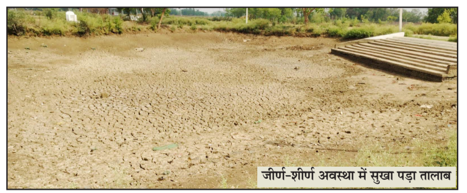
जीर्णो-शीर्ण अवस्था में सुखा पड़ा तालाब

नवबिहार टाइम्स संवाददाता ओबरा (औरंगाबाद)। प्रखंड क्षेत्र के सोनवर्षा स्थित सैकड़ों वर्ष पुराने तालाब की स्थिति लगातार गिरावटी जा रही है। तालाब में पानी सूख जाने से आम लोगों को भारी परेशानियों का सामना करना पड़ रहा है। जल संरक्षण को लेकर सरकार की जल-जीवन-हरियाली योजना के तहत कई प्रयास किए जा रहे हैं, लेकिन इस तालाब को ओर अब तक अधिकारियों का ध्यान नहीं गया है। करीब 12 कड़ों में फैला यह तालाब धीरे-धीरे सिमटता जा रहा है। नियमित सफाई और उड़ही (गाद नििकासी) नहीं होने के कारण इसकी गहराई कम हो गई है। ग्रामीणों के अनुसार, तालाब