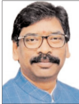
निर्देश दिए, जहां युवाओं की अधिक भीड़ रहती है। मुख्यमंत्री हेमंत सोरेन ने राज्य में अप्रैम की खेती को हर हाल में रोकने के निर्देश दिए। उन्होंने खुंटी, चतरा और रांची जिलों में विशेष सतर्कता बरतने को कहा। साथ ही लोगों को जागरूक करने और लगातार

मुख्यमंत्री ने लापता बच्चों और महिलाओं के मामलों पर त्वरित कार्रवाई के निर्देश दिए। उन्होंने कहा कि ऐसे मामलों को प्राथमिकता देते हुए सभी लापता बच्चों और महिलाओं की सुरक्षित बरामदगी सुनिश्चित की जाए। मुख्यमंत्री ने दोहराया कि राज्य में आम जनता को भयमुक्त वातावरण देना सरकार की प्राथमिकता है। मुख्यमंत्री ने अधिकारियों को निर्देश दिया कि नशीले पदार्थों के कारोबार के खिलाफ सख्त अभियान चलाया जाए। उन्होंने कहा कि ड्रग्स स्प्लॉइ चैन को पूरी तरह तोड़ना जरूरी है। इसके लिए उन स्थानों को चिन्हित किया जाए जहां नशीले पदार्थों की खरीद-बिक्री होती है और संबंधित अपराधियों के खिलाफ कड़ी कानूनी कार्रवाई की जाए। उन्होंने विशेष रूप से स्कूल, कॉलेज और अन्य शैक्षणिक संस्थानों के आसपास निगरानी बढ़ाने के