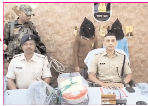
लातेहार में गिरफ्तार जेजेएमपी के उग्रवादी