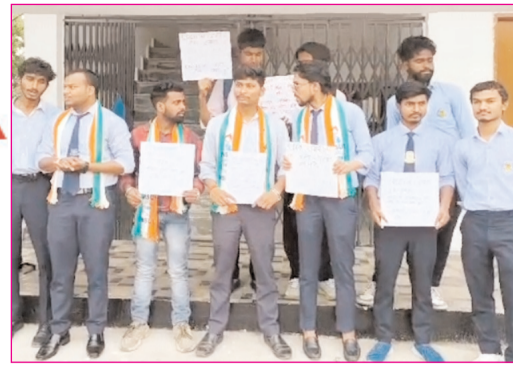
रांची के डोरंडा कॉलेज में प्रदर्शन करते एनएसयूआई के कार्यकर्ता