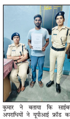
कुमार ने बताया कि साइबर अपराधियों ने यूपीआई फ्रांड कर

पुलिस ने ऑनलाइन ठगी के 1.5 लाख रुपये कराए वापस