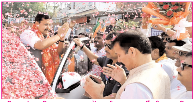
पश्चिम बंगाल विधानसभा चुनाव में भारतीय जनता पार्टी की अप्रत्याशित जीत पर पार्टी के राष्ट्रीय अध्यक्ष नितिन नवीन का हुआ शानदार स्वागत

* मूल्य : 3.00 रुपये * औरंगाबाद, पटना एवं बोकारो से प्रकाशित * www.navbihartime.com