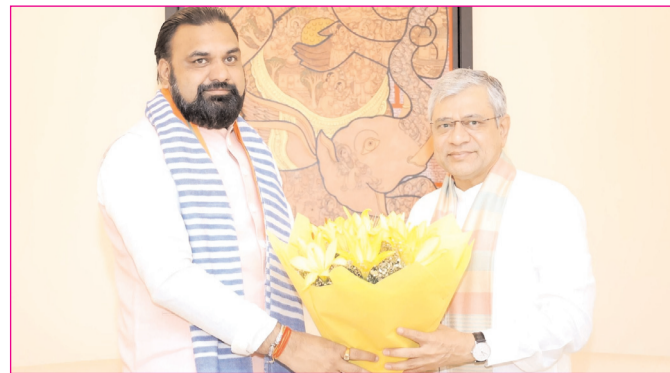
नयी दिल्ली में रेल मंत्री अश्विनी वैष्णव से मुलाकात करते बिहार के सीएम सम्राट चौधरी

* रजि. नंबर : 52290/90 * वर्ष : 36 * अंक : 334 * पृष्ठ : 12 * औरंगाबाद, सोमवार, 4 मई 2026 * मूल्य : 3.00 रुपये * औरंगाबाद, पटना एवं बोकारो से प्रकाशित * www.navbihartime.com