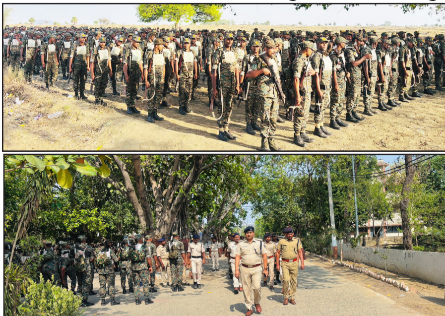
अधिकारियों की सतत निगरानी संपन्न हुआ। इस नाइट मार्च आपात परिस्थितियों, लंबी दूरी के में यह अभियान सफलतापूर्वक का मुख्य उद्देश्य जवानों को ऑपरेशन और चुनौतीपूर्ण हालात

प्रशिक्षु सिपाहियों ने दिखाई अदम्य क्षमता