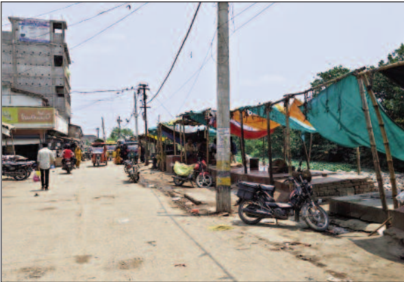
भरमार हो जाती है। इससे न केवल भस्मावृषि हो जाती है, बल्कि राहगीरों और बच्चों के आसपास के दुकानदारों को परेशानी होती है, बल्कि सामाजिक स्वास्थ्य पर भी प्रतिकूल प्रभाव पड़ता

आदापुर (पूर्वी चम्पारण)/नवबिहार टाइम्स संवाददाता। प्रखंड के श्यामपुर बाजार एरिया स्थित रेलवे के अतिक्रमित भूमि पर खुलेआम सड़क किनारे मांस और मछली काटकर बेचे जाने का मामला उजागर है , श्यामपुर बाजार के मुख्य मार्ग पर बिना किसी ढके स्थिति मे, बिना स्वच्छता व्यवस्था और बिना स्पष्ट लाइसेंस के मांस-मछली की बिक्री लगातार जारी है, जिससे स्थानीय लोगों में नाराजगी बढ़ती जा रही है। स्थानीय नागरिकों का कहना है कि बाजार क्षेत्र में खुलेआम मांस और मछली काटने से गंदगी, दुर्गंध और मखिच्चों की