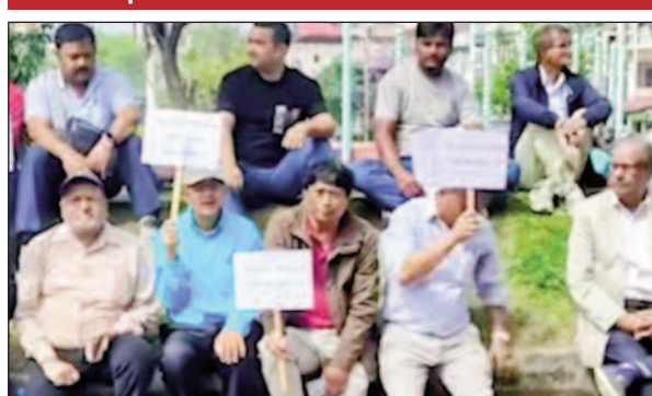
उचित मुआवजा और पुनर्वास के इस तरह की कार्रवाई अन्यायपूर्ण और अमानवीय है। एक व्यापारी ने भावुक होकर कहा, ढूढमने वर्षों की मेहनत और जमा पूंजी से अपना कारोबार खड़ा किया है। अगर इसे तोड़ दिया गया तो हमारे परिवार का भविष्य अधकार में चला जाएगा। वहीं एक स्थानीय निवासी ने कहा कि सरकार को पहले प्रभावित लोगों के लिए वैकल्पिक व्यवस्था सुनिश्चित करनी चाहिए, उसके बाद ही इस तरह की परियोजनाओं को लागू करना चाहिए। प्रदर्शनकारियों ने स्पष्ट चेतावनी दी कि यदि उनकी मांगों पर जल्द ध्यान नहीं दिया गया, तो आंदोलन को और व्यापक और उग्र किया जाएगा। यह मुद्दा अब केवल बीरगंज तक सीमित नहीं रह गया है, बल्कि राष्ट्रीय स्तर पर चर्चा का विषय बनता जा रहा है।

रक्सौल (पूर्वी चंपारण)/नवबिहार टाइम्स संवाददाता। बीरगंज की मुख्य सड़क के प्रस्तावित चौड़ीकरण के विरोध में प्रभावित घर मालिकों और व्यापारियों का आक्रोश राजधानी काठमांडू के माइतीघर मंडल में फूट पड़ा। सैकड़ों लोगों ने एकजुट होकर जोरदार प्रदर्शन किया और सरकार से अपने फैसले पर तत्काल पुनर्विचार की मांग की। गौरतलब है कि बीरगंज में मुख्य सड़क को दोनों ओर से 25-25 मीटर तक चौड़ा करने की योजना के तहत सड़क किनारे स्थित मकानों और दुकानों को तोड़ने का आदेश जारी किया गया है। इस फैसले से हजारों परिवारों के सामने बेघर होने और व्यापारियों के सामने रोजी-रोटी छिन्ने का संकट खड़ा हो गया है। माइतीघर मंडल में प्रदर्शन कर रहे लोगों ने तख्तियां और बैनर के साथ सरकार के खिलाफ नारेबाजी की। प्रदर्शनकारियों का कहना था कि वे विकास के विरोधी नहीं हैं, लेकिन बिना